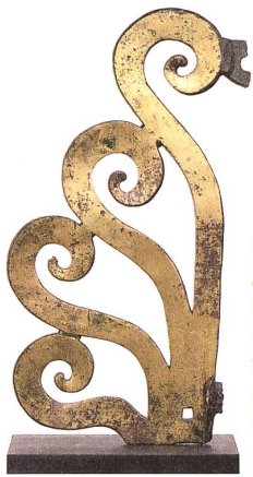
Fig. 2: Acrotère en bronze doré ornant le sommet de la toiture du temple de la Grange des Dîmes.

Si l'on pouvait remonter le temps de quelque deux millénaires et partir à la découverte des villes romaines, on serait certainement surpris de voir combien celles-ci étaient bigarrées. En effet, les édifices antiques étaient la plupart du temps rehaussés de couleurs vives et ornés de marbres polychromes. Il en va de même pour les statues de dieux, d'empereurs ou de notables sculptés dans la pierre. Celles en bronze – parfois doré à la feuille – pouvaient avoir des teintes étonnamment variées grâce à des incrustations et des techniques complexes de traitement des patines. Placées au forum, dans les cours des maisons, sous les portiques, sur les esplanades des temples, elles devaient briller sous le soleil, tout comme les quadriges ou les acrotères qui agrémentaient arcs de triomphe et toitures de monuments publics.