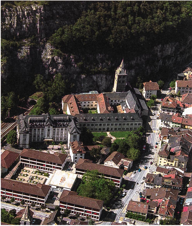
Vue générale de l'Abbaye de Saint-Maurice d'Agaune, Valais.

M erveilleuse destinée que celle de Saint-Maurice d'Agaune! Lieu de culte dès l'Antiquité celte, Agaune deviendra Saint-Maurice par son baptême dans le sang des martyrs thébains, au tournant du IV ème siècle. En 515, la fondation d'un monastère royal va donner à cette petite cité un rayonnement international jamais interrompu, et le culte des martyrs se répandra jusque dans les régions les plus éloignées. Aujourd'hui encore, la communauté religieuse qui dessert le monastère pratique sans relâche la prière perpétuelle, comme chaque jour depuis sa création.