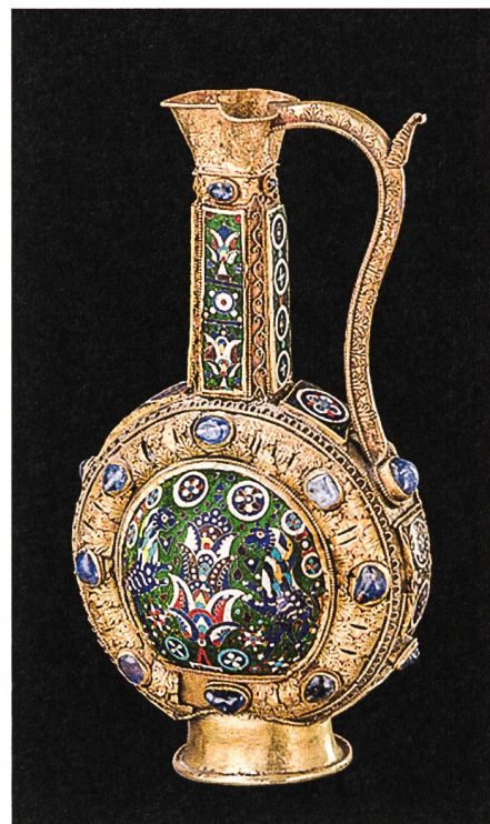
Aiguière dite de Charlemagne, seconde moitié du IX e siècle.

Les vestiges archéologiques témoignent ici d'un centre religieux de grande envergure, mis en place par l'évêque Théodore dès le IV e siècle, puis favorisé par le roi Sigismond au VI e siècle. Le programme architectural comprenait alors l'église martyriale au pied du rocher, une deuxième église alignée sur la première, un grand bâtiment de réception pour l'abbé-évêque ou roi-abbé et surtout un baptistère, constituant le centre symbolique et spatial du complexe religieux.