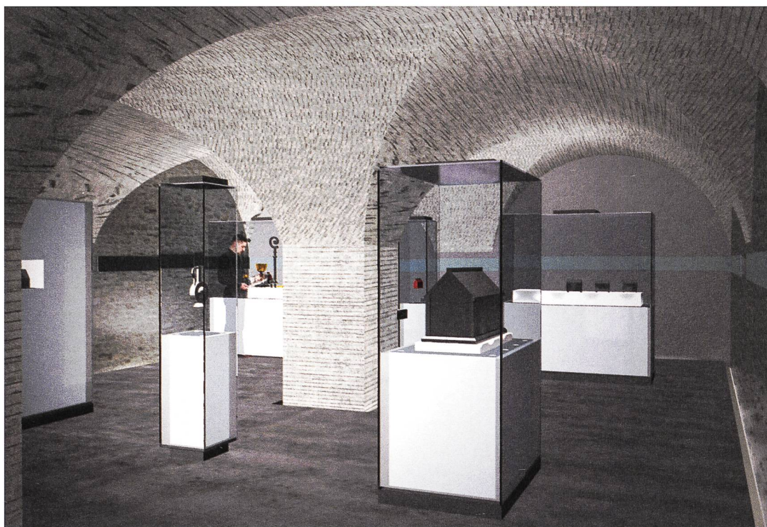
Vue pré-figurative de la muséographie de la nouvelle salle d'exposition du Trésor abbatial.

tuant le témoignage unique d'une activité spirituelle et culturelle sans équivalent dans le monde occidental. Un ensemble qui ne peut se découvrir que progressivement, en cheminant pas à pas, à la découverte de l'esprit des lieux.