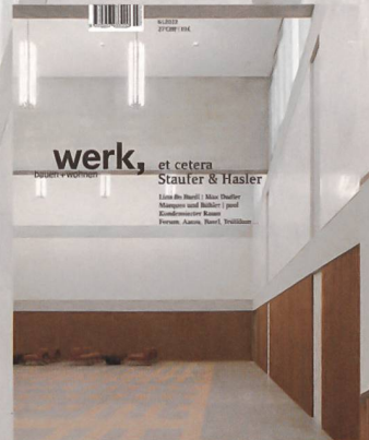
6|12 et cetera Stauer & Hasler

Bestellen Sie ein kostenloses Ansichtsexemplar orders@wbw.ch www.wbw.ch