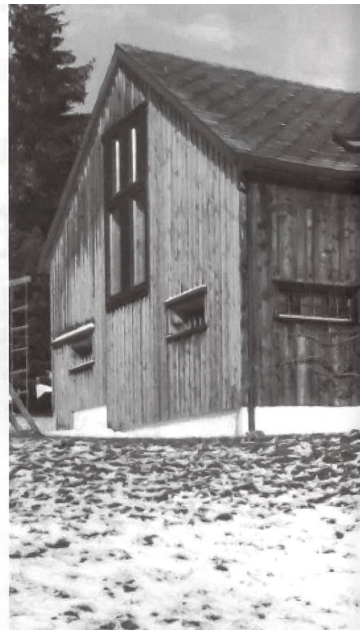
Geschickte Neunutzung des Scheunenteils bei einem Bauernhaus in Wildhaus (SG) ohne merklichen Substanzverlust und störende Eingriffe in das Erscheinungsbild.