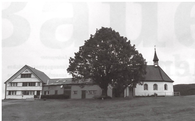
Ein Ersatzbau in der traditionellen Formsprache kann unter Umständen ein Kompromiss sein, wenn damit ein schützenswertes Ensemble bewahrt wird. Es handelt sich dabei aber immer um einen Neubau ohne baugeschichtlichen Bezug.

Kapelle ist wohl im Erscheinungsbild aber nicht mehr in der baulichen Substanz gegeben. Beim dritten Bauernhaus drang der Eigentümer mit einem Neubauprojekt nicht durch. Ein Abbruch und Wiederaufbau, neu auf der Westseite der Scheune, widersprach den gesetzlichen Ansprüchen der Identität und wurde trotz authentischer Architektur abgelehnt. So steht das Bauernhaus heute dem Zerfall nahe.