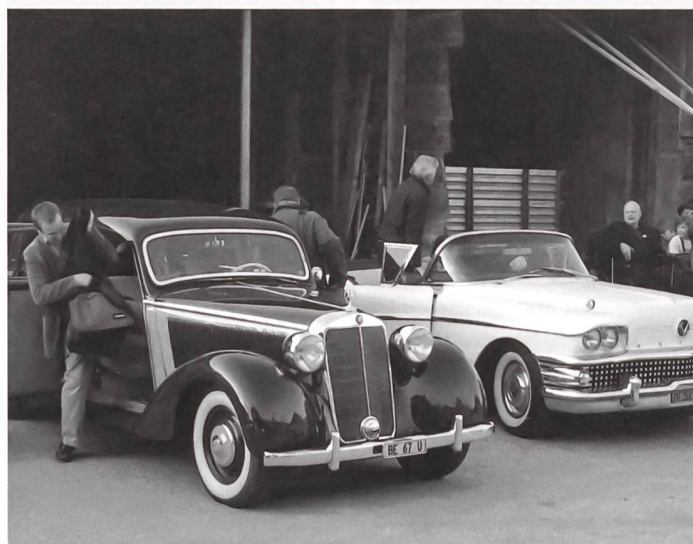
Grâce à la Fédération Suisse des Véhicules Anciens un service de taxi avec des véhicules historiques pouvait être offert aux participant-e-s de l'assemblée générale du Centre NIKE.

Le Centre NIKE a reçu en 2011 des soutiens financiers pour des projets spécifiques de la part des institutions et organisations suivantes: la Section patrimoine culturel et monuments historiques de l'OFC, l'Académie suisse des sciences humaines et sociales (ASSH), Armasuisse, la Fédération des architectes suisses