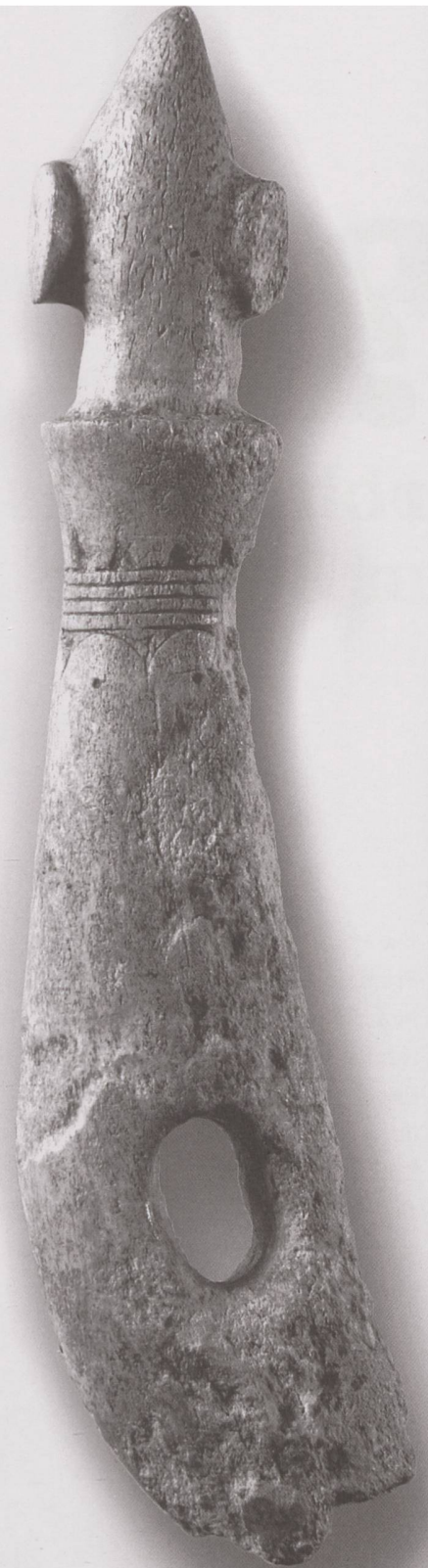
In der frühbronzezeitlichen Höhensiedlung Schönholzerswilen-Toos-Waldi wurde ein als Pferdgeschirrbestandteil anzusprechender Geweihknebel gefunden, der vermutlich im Karpatenbecken hergestellt wurde. 17./16. Jh. v. Chr.

Gleichwohl darf die Bedeutung des Landverkehrs nicht unterschätzt werden. So zeugen Pferdetrassen, die ab der frühen