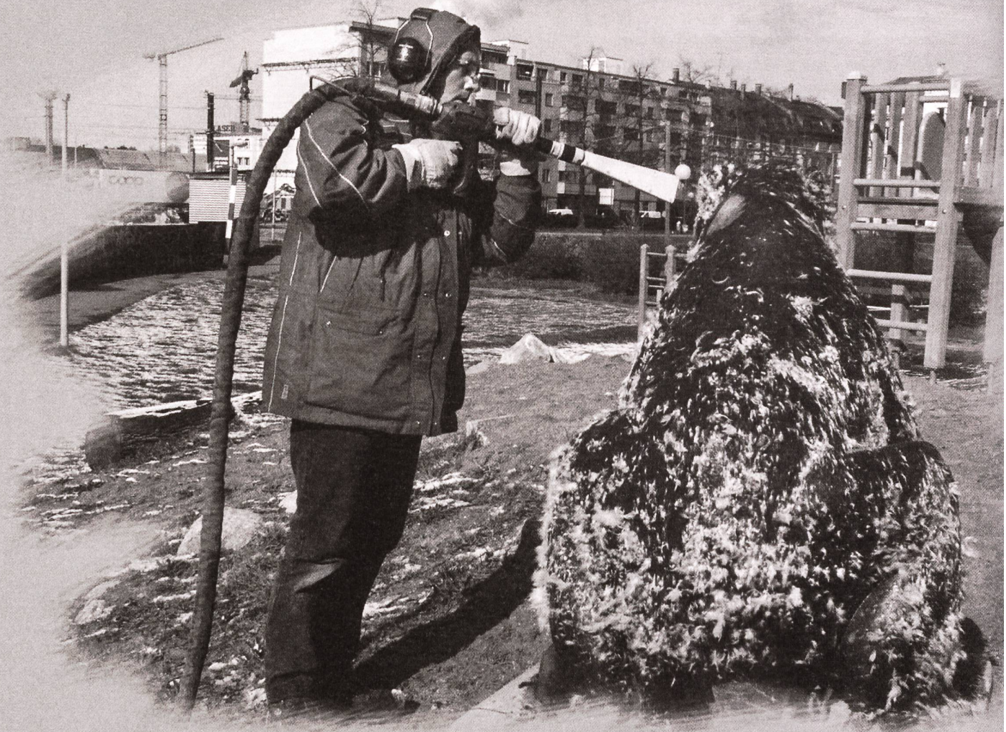
Grobreinigung mit Trockeneis eines mit Bitumen verschmierten Bären aus Marmor im Basler Voltpark.