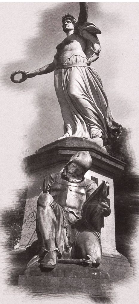
Das St. Jakobs-Denkmal in Basel: Verschiedenste Verschmutzungsarten erfordern ein differenziertes Reinigungskonzept.

Am Beispiel des St. Jakob-Denkmal in Basel kann der Fortschritt der Reinigungstechniken einhergehend mit dem Wandel der denkmalpflegerischen Philosophie aufgezeigt werden. Die fünf Skulpturen bestehen aus Carrara-Marmor und wurden vom neoklassizistischen Bildhauer Ferdinand Schlöth geschaffen. Seit der Enthüllung 1872 sind durchschnittlich alle 10 bis 20 Jahre Eingriffe erfolgt. Schon 1883 ist die erste Reinigung belegt, die zweite erfolgte 1904 in Form einer «gründlichen Abarbeitung», die auch ein Überschleifen der ver-