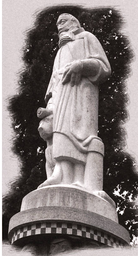
Der Wettsteinbrunnen in Basel: Die 60-jährige Brunnenfigur aus Kalkstein wird regelmässig mit Javellewasser-Lösung gereinigt und ist «so weiss wie nie zuvor».

Javellewasser wird vielfach grundsätzlich – und ohne Kenntnisse über dessen Reaktion – von Hauswarten und Putzequipen zur Reinigung von Steinobjekten, vor allem Brunnenanlagen, eingesetzt. Auch Steinmetze und Bildhauer bedienen sich beim Reinigen von Grabsteinen der vermeintlich reinigenden Wirkung von Kalibleichlauge [KOCI]. Dieses Kaliumhypochlorit wirkt stark oxidierend. Daraus erklärt sich die bleichende Wirkung von Javellewasser. Dessen Weissstönung reinigt Objekte nicht, sondern macht sie so hell, wie sie nie zuvor gewesen sind.