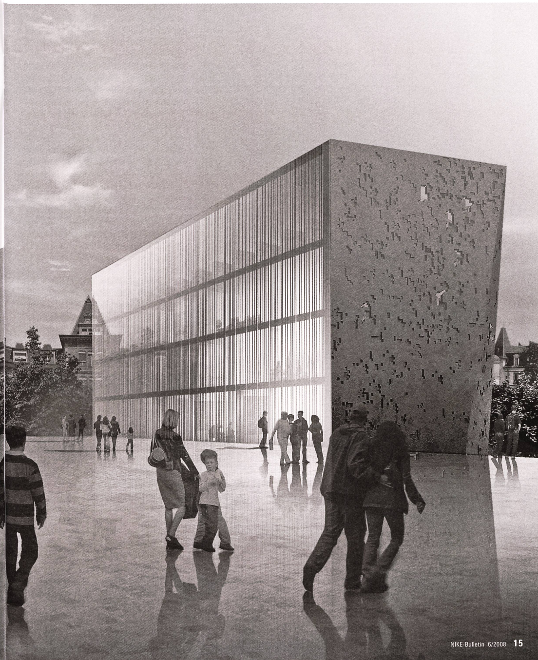
Das Dach des neuen Ausstellungssaales ist zugänglich und wird zum Podest, das den Blick auf alte und neue Gebäudeteile ermöglicht.