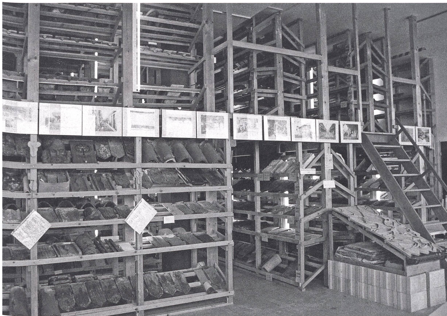
Museum und Depot zugleich: Der Sammlungsraum im Industriequartier von Cham.