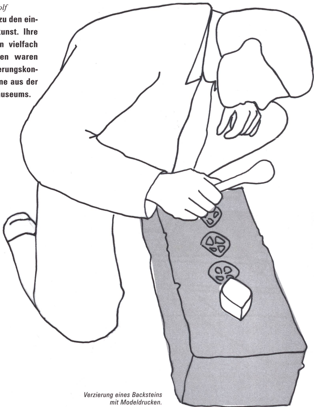
Verzierung eines Backsteins mit Modelldrucken.

Die Backsteine von St. Urban LU gehören zu den eindrücklichsten Beispielen der Backsteinkunst. Ihre Geschichte und ihre Herstellung wurden vielfach untersucht. Interdisziplinäre Forschungen waren Grundlage für ein umfassendes Konservierungskonzept für einige stark gefährdete Backsteine aus der Sammlung des Schweizerischen Landesmuseums.