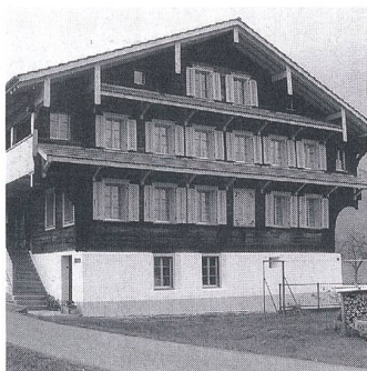
Alpach Dorf, Wohnhaus Grund: Das typische Obwaldner «Tätschdachhaus» aus dem 17. Jh. konnte 2002 umfassend restauriert werden.

schutz in Obwalden» und des vom Europarat initiierten Europäischen Denkmalschutzjahres 1975 fing man mit der Aufnahme des ländlichen Baubestandes von Obwalden an. Auf Grundlage des vom Lokalhistori-