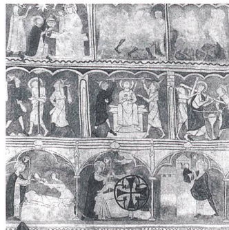
St. Niklausen OW, Kapelle St. Niklaus: Ausschnitt aus dem Freskenzyklus im Chor, 14. Jh. Dieses bedeutende Werk mittelalterlicher Kunst wurde von Robert Durrer vor der Zerstörung bewahrt.

Im Sommer 1895 hatte Durrer bei einem Besuch der Kapelle St. Niklaus hinter dem Hochaltar Reste einer Wandmalerei entdeckt. Da er von der geplanten Renovation wusste, bat er um frühzeitige Be-