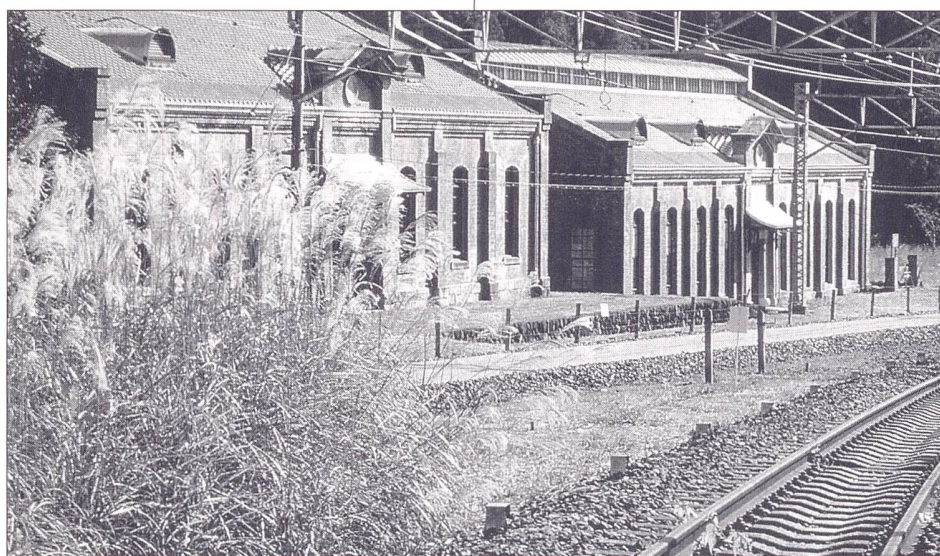
Usui-Toge-Bergstrecke nach der Restaurierung eines Teilstücks mit Wanderweg und renoviertem Umformerwerk.