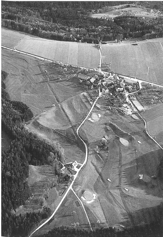
Der Limes beim Haghof, Gemeinde Alfdorf (Rems-Murr-Kreis)

Die beiden in Privatbesitz befindlichen Gärten zeichnen sich durch die hervorragende Verbindung von Architektur und gestalteter Umgebung aus: beide Anlagen bergen noch einen reichhaltigen Schatz an Originalsubstanz.