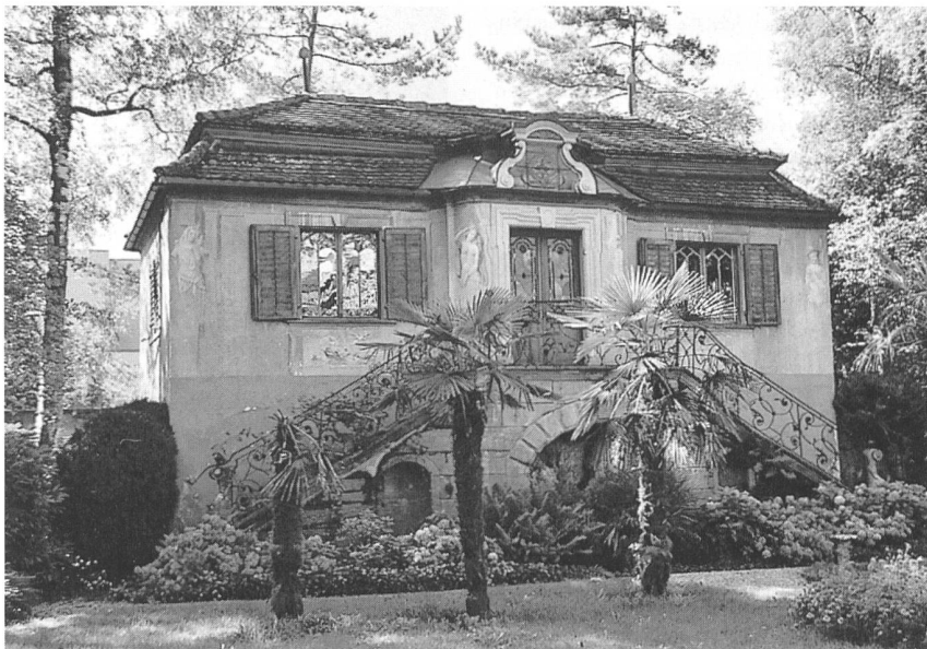
Der Löwenhof in Rheineck SG

Schloss Oberdiessbach bildet mit seinem Garten das bemerkenswerte Beispiel einer bernischen Campagne aus der Zeit des Barock. Das Anwesen ist seit elf Generationen im Besitz der Familie von Wattenwyl und wird mit grossem Einsatz gepflegt. Seit kurzem wird das interessierte Publikum (nach Voranmeldung) zur Besichtigung in Garten und Schloss eingeladen.