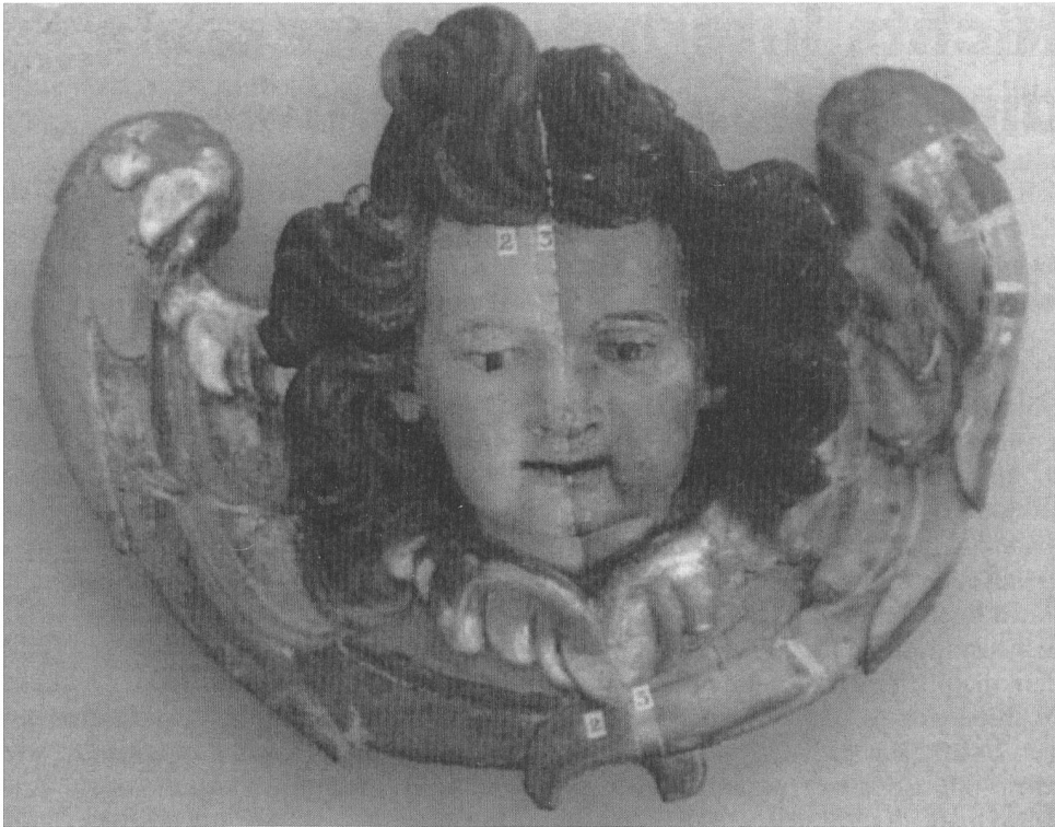
Illustration: «Restauration der barocken Altäre in Montet (FR)», page 13