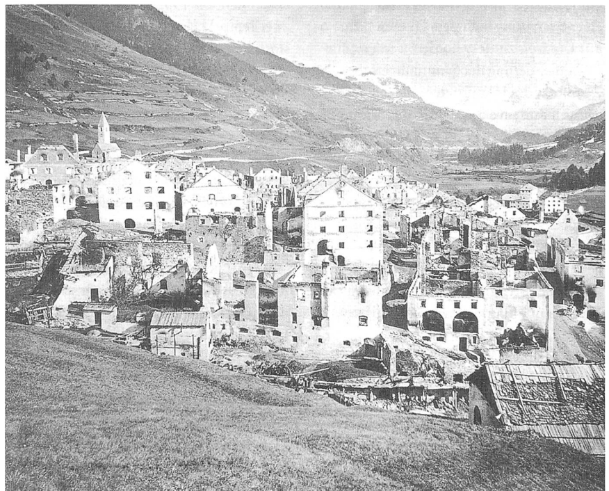
Lavin, nach dem Brand vom 10. Oktober 1869