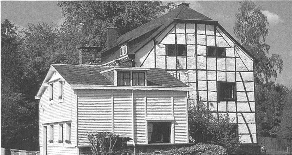
Journée européenne du Patrimoine 1996: Un exemple de la Wallonie «Patrimoine en milieu rural» (Foto: Patrick Hoffsummer, Les pans-de-bois)