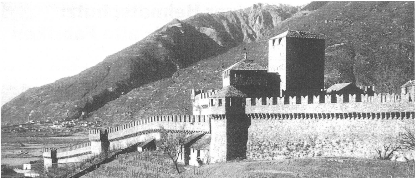
Bellinzona, Castello Montebello: Zukünftig auf der UNESCO- Liste des Weltkulturerbes?