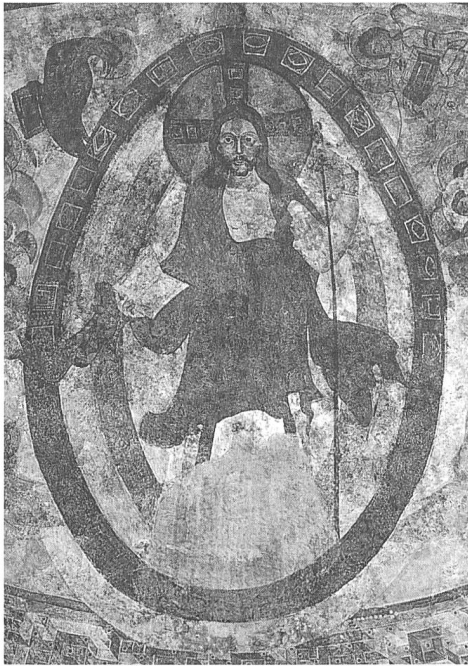
Kalotte der Mittelapsis, Salvator Mundi

scher Zeit, um 1170, also aus der Zeit Kaiser Friedrichs I., freigelegt.