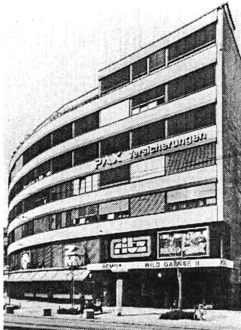
Die renovierte Fassade des "Z-Hauses" in Zürich

renovationen aus einem Jahrzehnt und die Geschichte der Zürcher Bauernhauskonstruktion. Dazu kommen einzelne Beispiele wie das Z-Haus aus den 30er Jahren im Kreis vier, die denkmalpflegerisches Neuland sind.