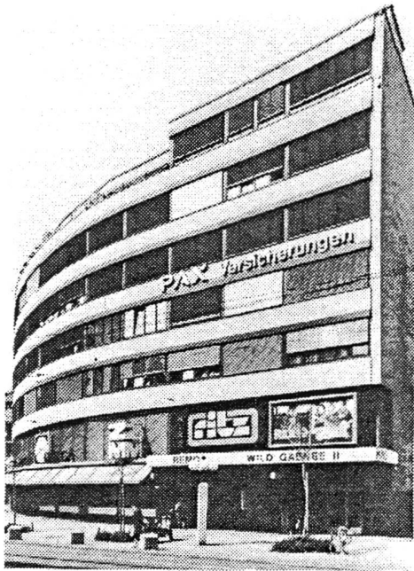
Die renovierte Fassade des "Z-Hauses" in Zürich (Aus "Zürcher Denkmalpflege, 10. Bericht, 2. Teil")

renovationen aus einem Jahrzehnt und die Geschichte der Zürcher Bauernhauskonstruktion. Dazu kommen einzelne Beispiele wie das Z-Haus aus den 30er Jahren im Kreis vier, die denkmalpflegerisches Neuland sind.