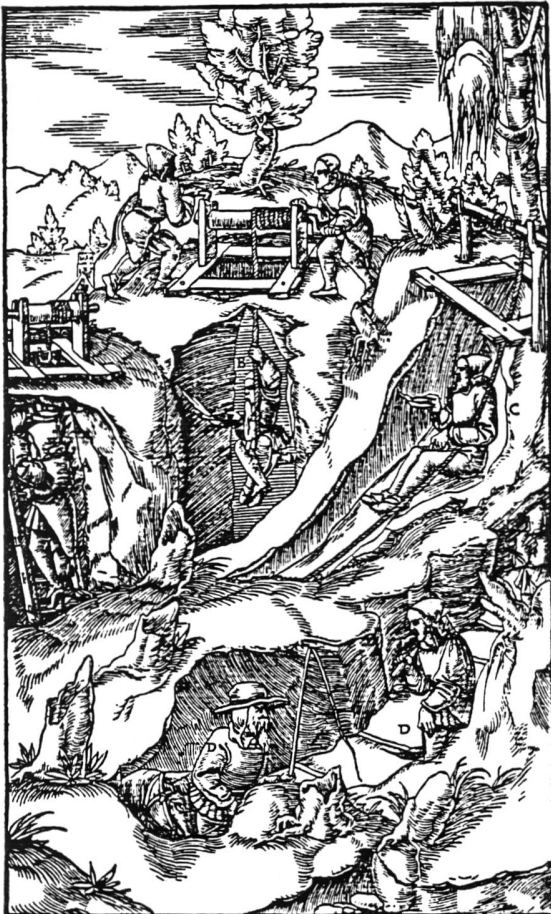
Einfahrende Bergleute (Aus "Bergwerk Herznach")