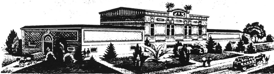
Les caves Malaga de Lenzbourg, 1889-1986.