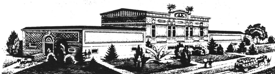
Malaga-Kellerei Lenzburg 1889-1986