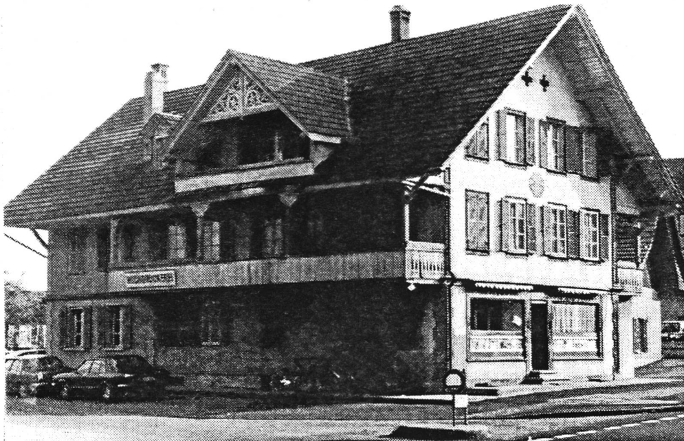
"Altes Konsum", Dorfstrasse, Uetendorf

Um dieses Gebäude zu retten, hat die Kulturzunft Dorflüt erreicht, dass sich die Gemeinde (Besitzerin) und die Gürbetalbahn (Interessentin) darauf einigten, eine zweijährige Frist zu gewähren, um die Planung des Bahnhof-Areals nicht durch den Abbruch des "Alten Konsums" in vorbestimmte Bahnen zu leiten.