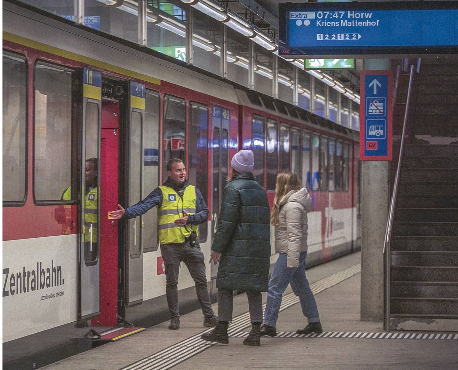
Allmend/Messe ist die einzige unterirdische Haltestelle der Zentralbahn.

schichte und soll dann erzählt werden, wenn die Zeit dazu reif ist.