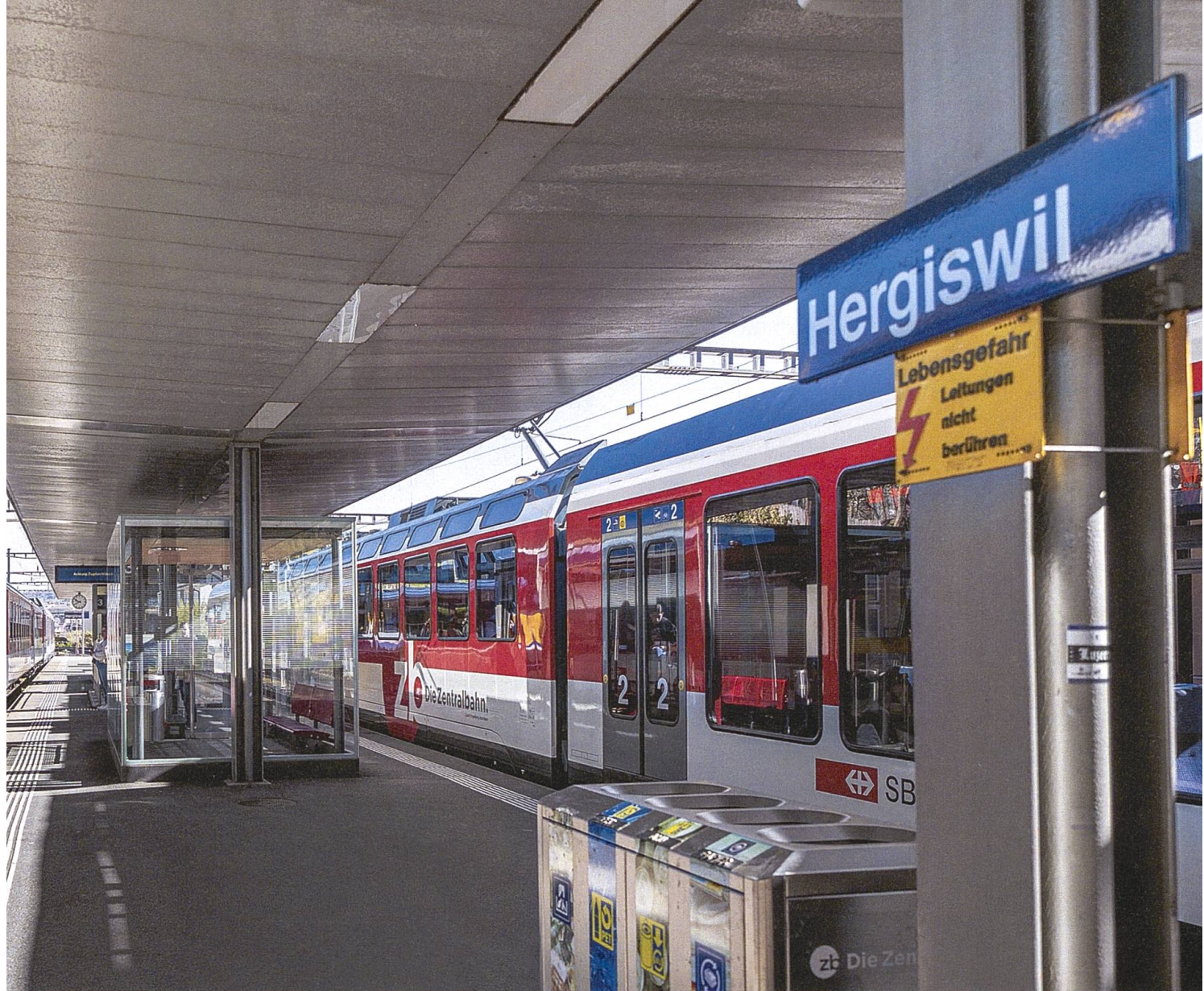
Bahnhof Hergiswil: Hier kommen die Engelberg- und die Brüniglinie zusammen.

zog wie ein braves Pferd die Kutsche. Heute haben auch die Waggons Motoren eingebaut, die gemeinsam mit der Lok sich selber antreiben oder umgekehrt die Lok beim Bremsen unterstützen. Man kann sich das vorstellen wie eine Kompanie Soldaten, die sich auf das Kommando «Marsch» allesamt gleichzeitig in Bewegung setzen.