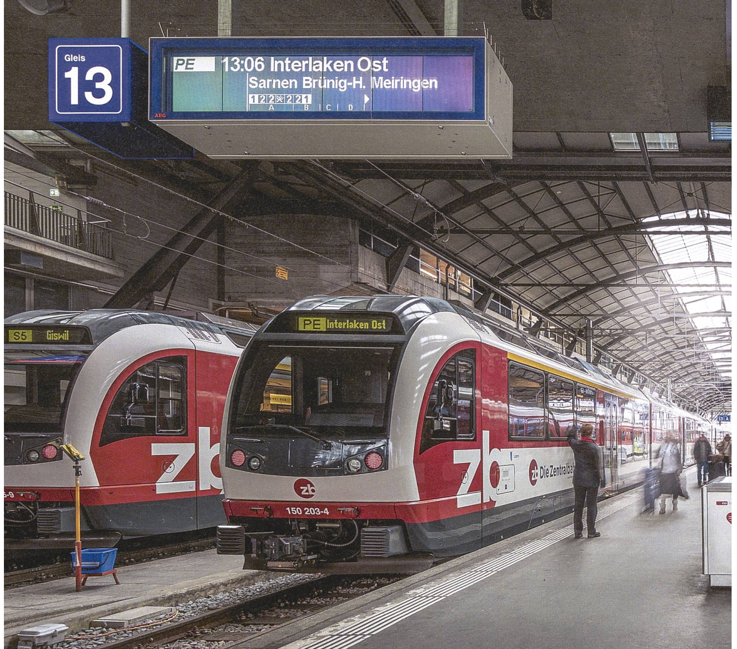
Ein Ziel, zwei Linien: Der Bahnhof Luzern ist Ausgangs- und Zielpunkt sowohl der Pendler als auch der Touristen.

die während der Corona-Zeit einen Zuwachs von Zusteigern verzeichnete. Bei allen anderen sanken in dieser Zeit die Passagierzahlen deutlich. Heute ist die Verbindung der Zentralbahn nach Luzern die grösste Zubringerlinie zum Bahnhof, aus keinem anderen Agglomerationsgebiet pendeln so viele Menschen nach Luzern. Und es hat inzwischen sogar einen eigenen Namen: Luzern Süd. Das alles bedeutet für die Zentralbahn: Sehr weit vorausdenken, zehn, zwanzig, dreissig Jahre. Eng mit den Städtebauern mitplanen. Den Zugverkehr verdichten, Kapazität erhöhen, Rollmaterial bestellen.