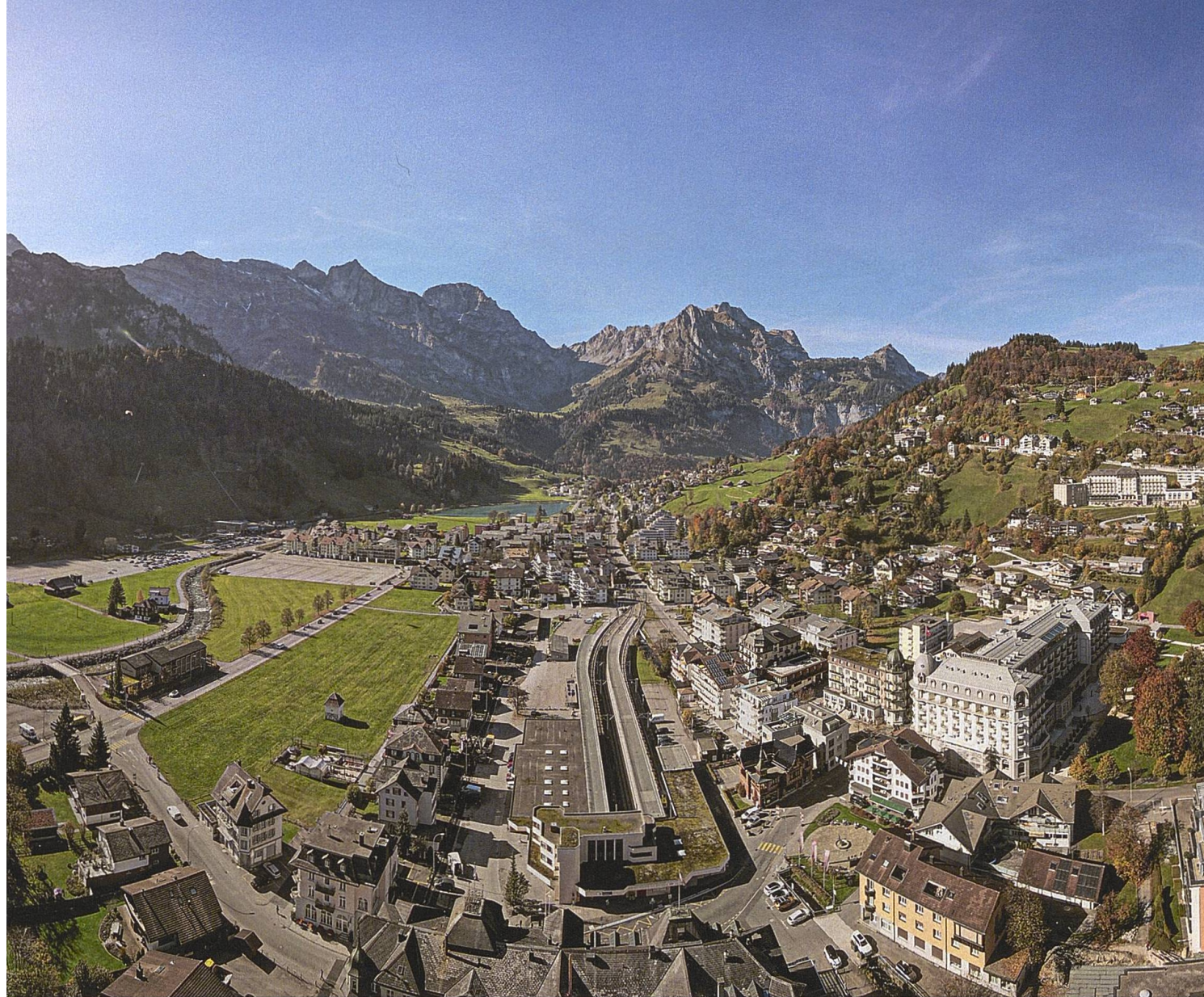
Die Reise beginnt in der Tourismus-Hochburg Engelberg. Das Dorf wächst kontinuierlich.

Taktfahrplan, was nichts anderes bedeutet als Regelmässigkeit.