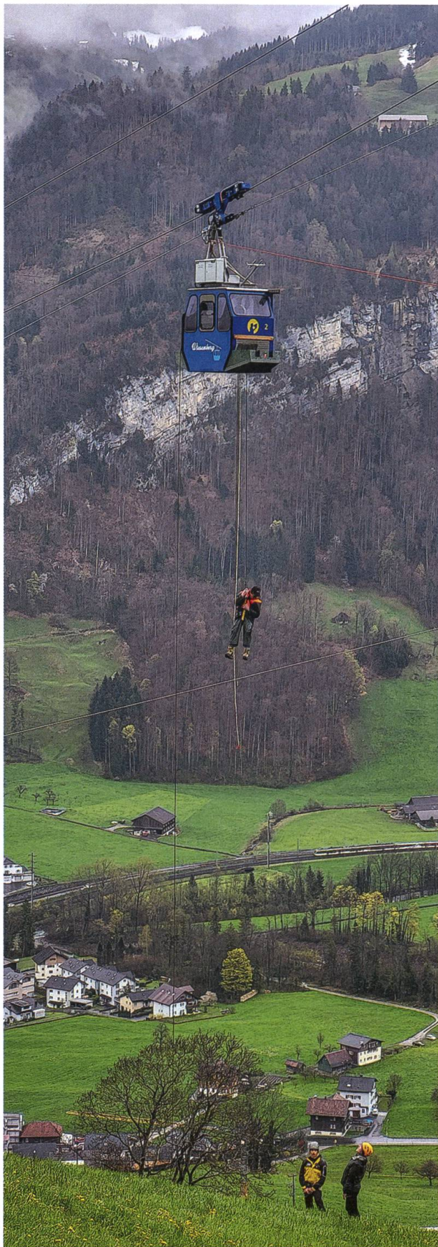
Während der obligatorischen Rettungs- Übung im April 2023 nach der Revision der Wiesenbergbahn.