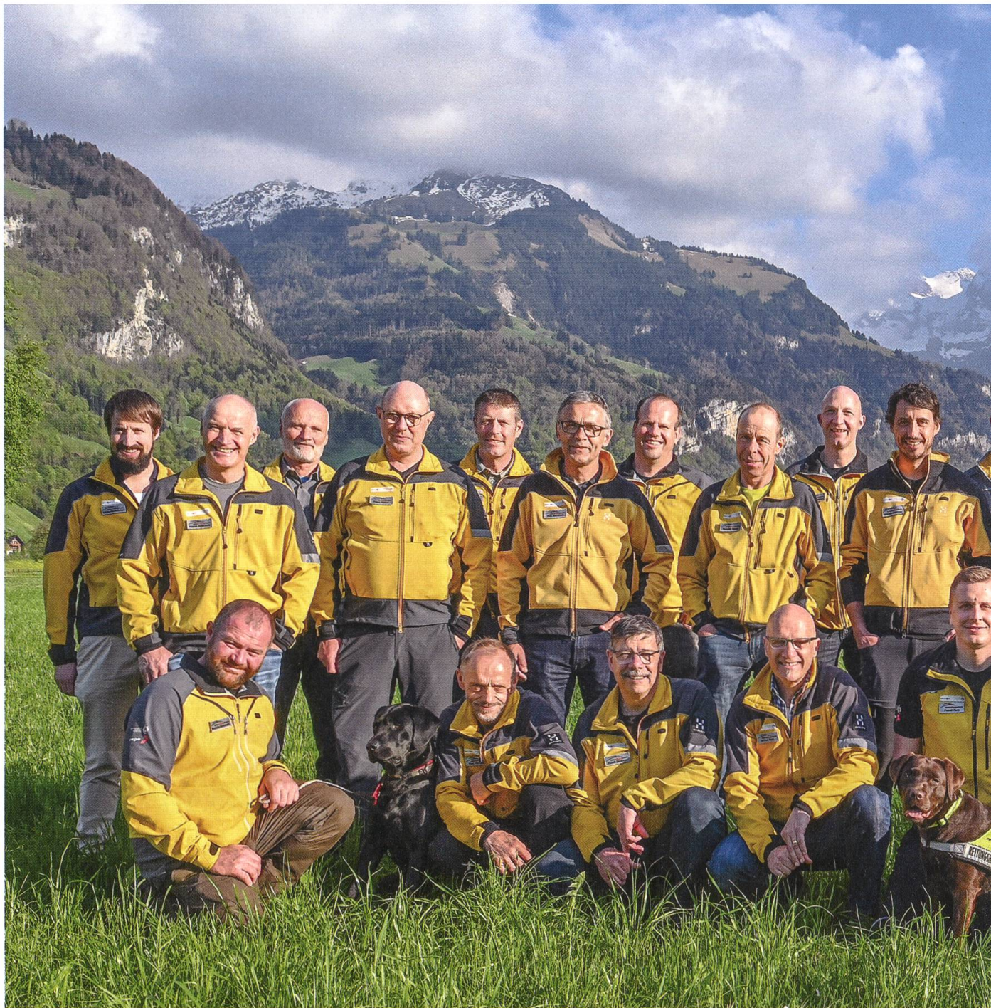
Die Helden, fotografiert im Mai 2023: Das Bergrettungsteam Stans 5.15 besteht aus 32 Männern, 3 Frauen und 4 Hunden

den viel umständlicher zu transportierenden Deltasegler in der Beliebtheitsskala als Fortbewegungsmittel in der Luft abgelöst.