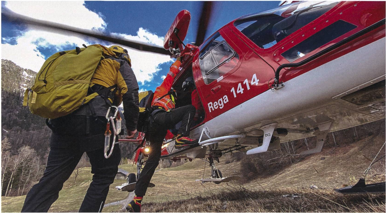
Schneller geht's mit dem Heli. Die Alpine Rettung und die Rega arbeiten seit jeher eng zusammen.

südlichen Teil des Kantons übernimmt die Rettungsstation Engelberg 5.14 ab Grafenort die Einsätze in den zur Gemeinde Wolfenschiessen gehörenden Gebieten Lutersee, Arni, Trübsee, Jochpass und Titlis.