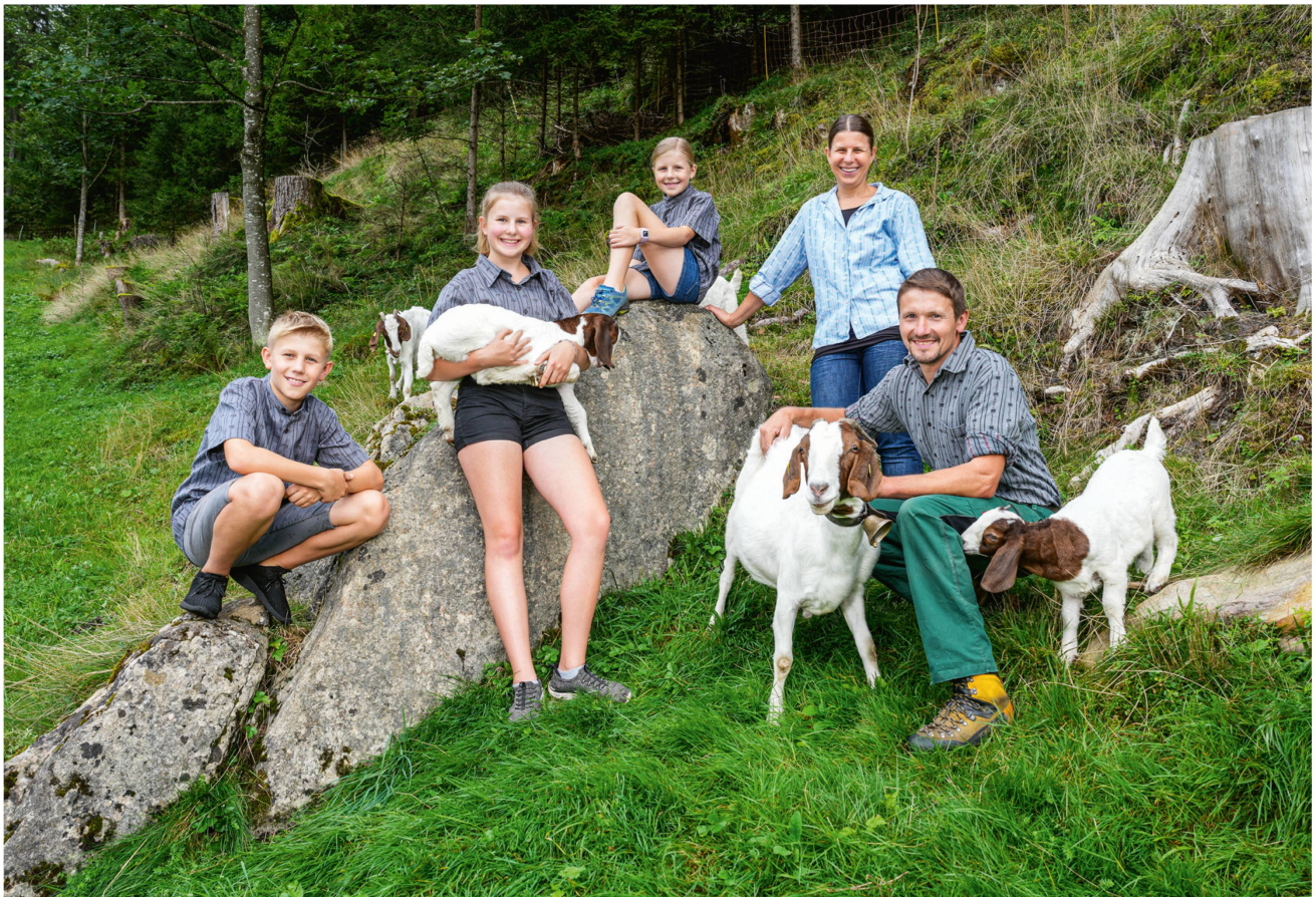
Bei Keisers im Eigenthal gilt auch für die Ziegen: Die Familie bleibt beisammen.

Die grosse Reise haben sie nachgeholt – und zudem weitere Yaks angeschafft, jetzt ist's eine Kleingruppe. Die haarigen, grunzenden Rinder passen perfekt in die wilde Landschaft am Pilatusfuss, man fühlt sich bei ihrem Anblick sofort auf ferne Gipfel oder in märchenhafte Gefilde aus «Herr der Ringe» versetzt. Allzu nah sollte man diesen exotischen Tieren nicht kommen, sie verteidigen – wie unsere heimischen Mutterkühe übrigens auch – ihre Jungen oder bedrängen einen aus lauter Neugierde. «Die Dynamik in Mutterkuhherden ist höher als bei Milchkühen, die Tiere sind lebhafter, handeln stärker nach ihrem Instinkt», erklärt