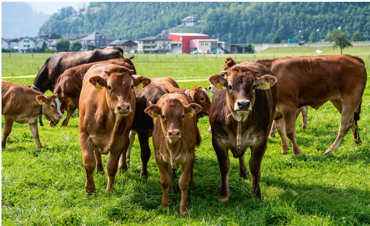
Kälber und Rinder sind von Natur aus neugierig und beobachten gern Spaziergänger.

Tiere genau kennt und sie im Stall namentlich anspricht.