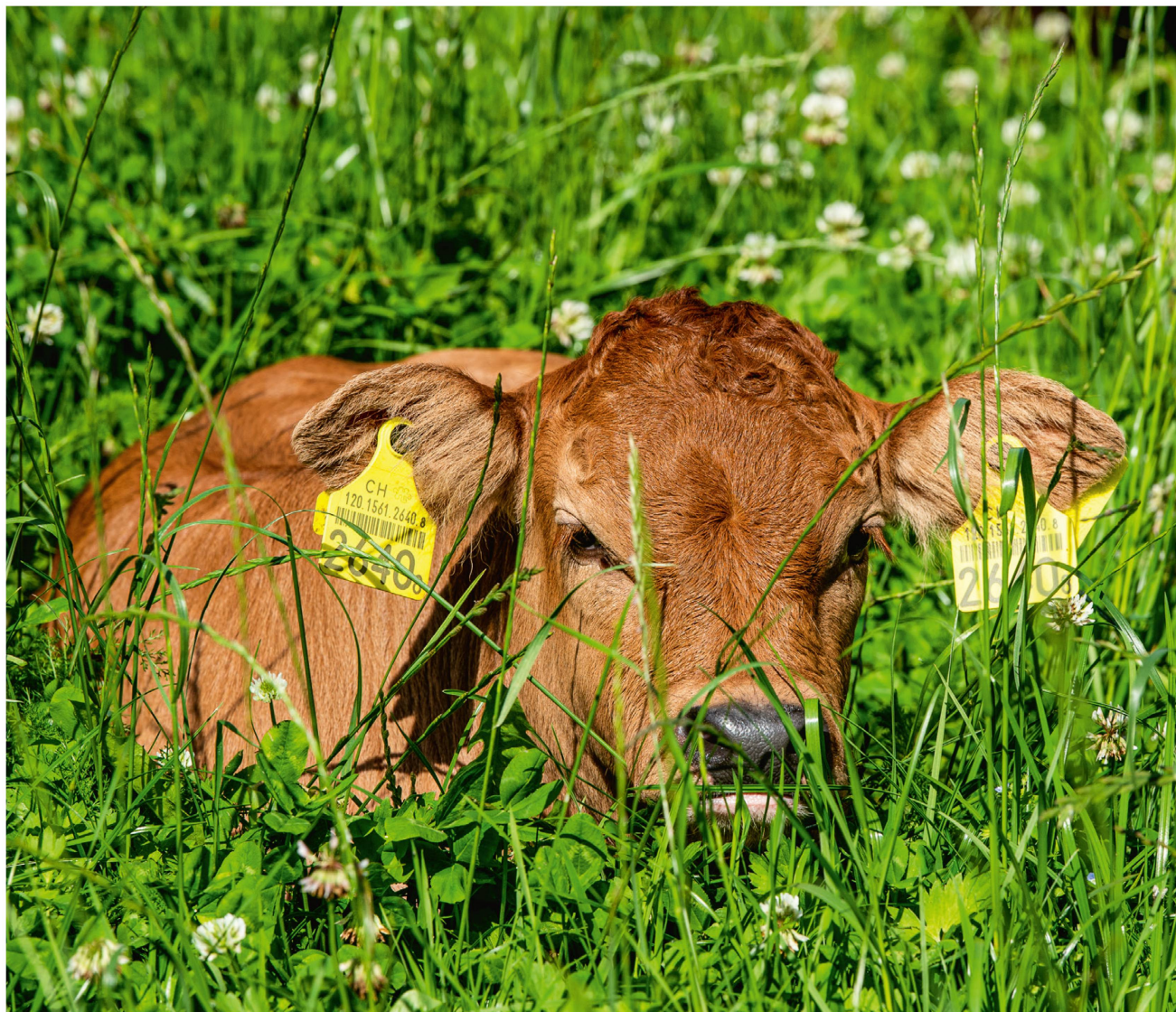
Glück im Gras: Die Kälber von Mutterkühen verbringen ihr Leben im Grünen.

eingestellten Kühen in Intensivhaltung, die nie ins Freie dürfen, sieht die Umweltbilanz weniger gut aus.