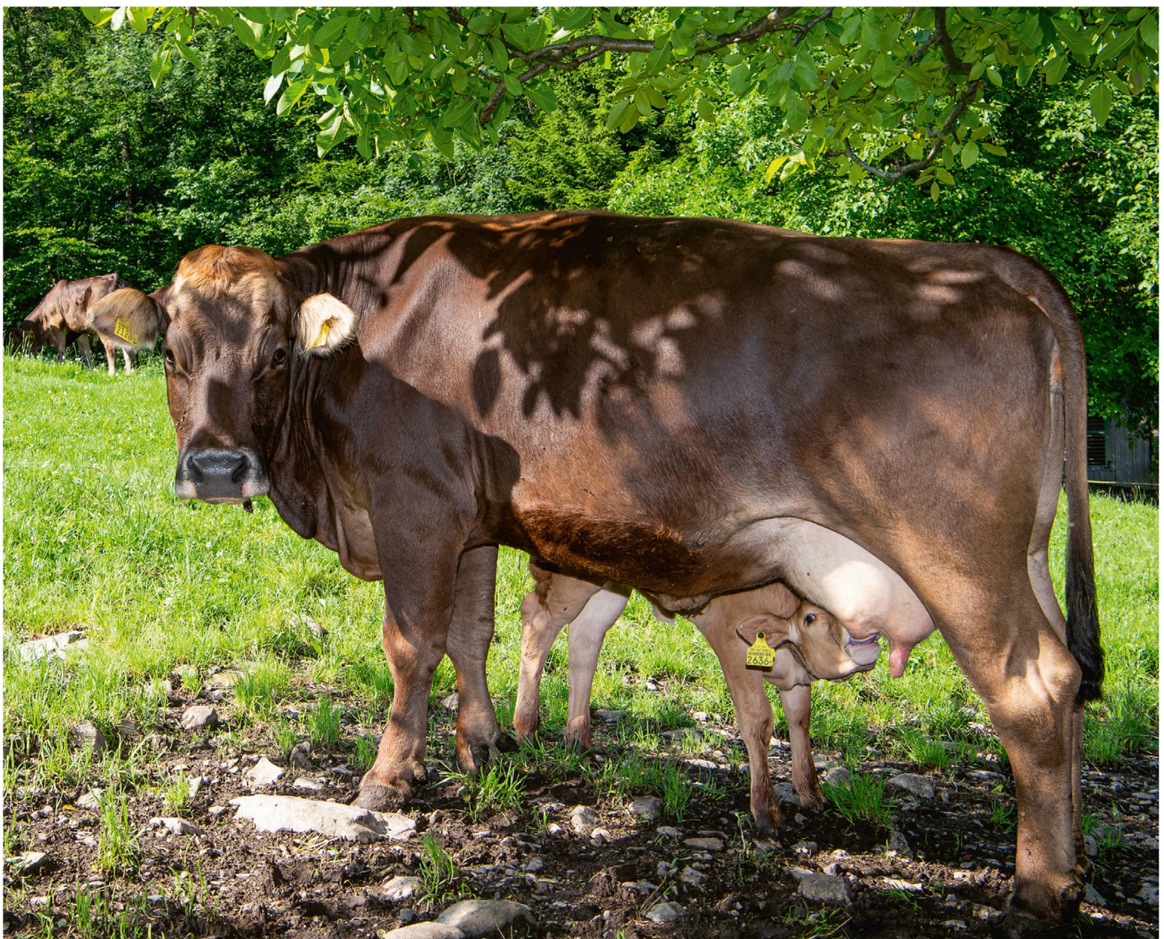
Die Kälber trinken nach Lust und Laune, bei der Mutter oder bei einer «Tante».

Anfänglich habe sie die Pakete auch ausgeliefert, eine Herausforderung, weil die Kühlkette ja keinesfalls unterbrochen werden darf. «Und die Leute kommen ja gern bei uns vorbei, um ein bisschen Landluft zu schnuppern.»