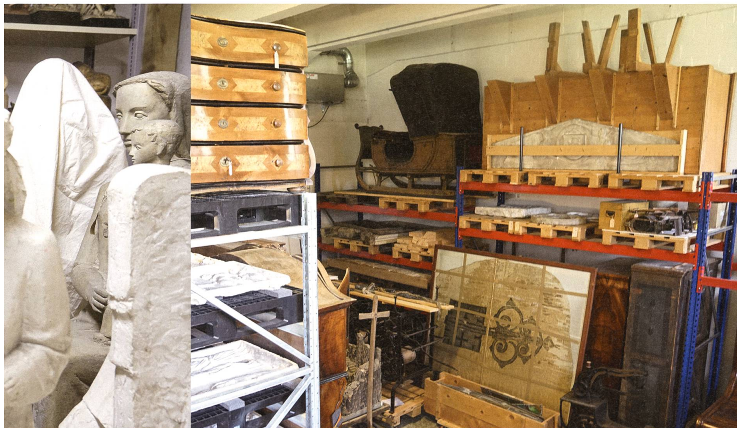
Depot Rotzhalde: hinten links Schlittenkutsche, vorne in der Mitte Fahne aus dem 17. Jahrhundert.