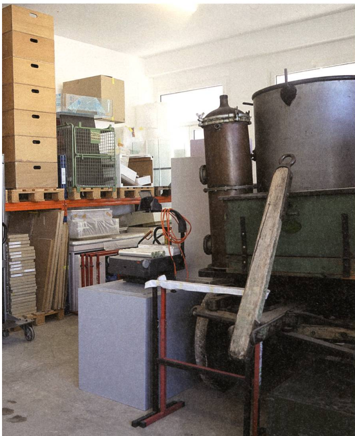
Gehört auch dazu: Verpackungsmaterial im Winkelriedhaus.

«Zwar habe ich selber eher einen kultur- als einen kunstwissenschaftlichen Hintergrund», sagt Carmen Stinimann, «trotzdem weiss ich genau: Die Bilder und Objekte, die uns die