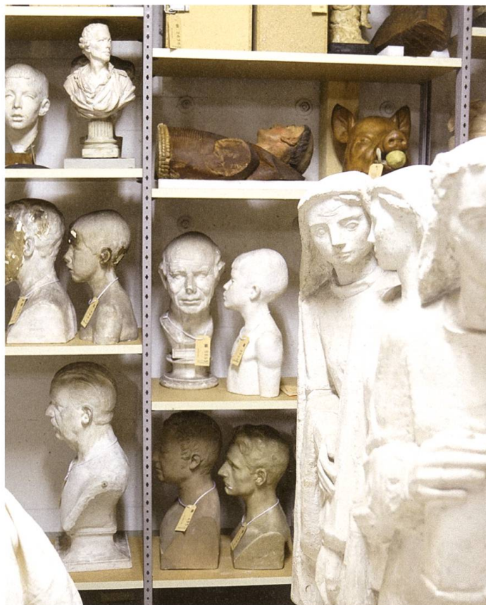
«Die drei Marien am Grabe» von Hans von Matt.

Wie schliesslich der Handel für ein ausgewähltes kunsthistorisches Objekt zustande komme, möchte ich wissen. Ob da auch Geld im Spiel ist? «Für Gegenstände, die uns angeboten werden, bezahlen wir grundsätzlich nichts», erklärt Carmen Stirnimann. In den meisten Fällen hätten ja die Leute dafür keinen Platz oder keine Verwendung mehr.