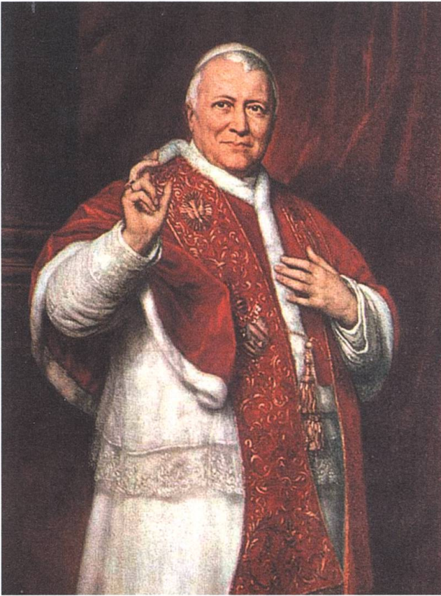
Papst Pius IX. hatte den Status eines Idols.

Historiker Urs Altermatt in seinem Standardwerk «Katholizismus und Moderne» analysiert: «... mit Zeitungen und Volksschriften, mit Vereinen und Wallfahrten propagierte die Kirche nach 1850 das ultramontane Frömmigkeitsideal, vereinheitlichte den Volkskatholizismus und merzte lokale Eigenarten der Volksfrömmigkeit mit Erfolg aus. Damals entstand das berühmte katholische Milieu, das fortan das Alltagsleben der Durchschnittskatholiken ... prägte. Wie nie zuvor gelang es der Amtskirche, einheitliche Vorstellungen über den guten Katholiken zu propagieren und die Masse der kleinen Leute damit zu disziplinieren.»