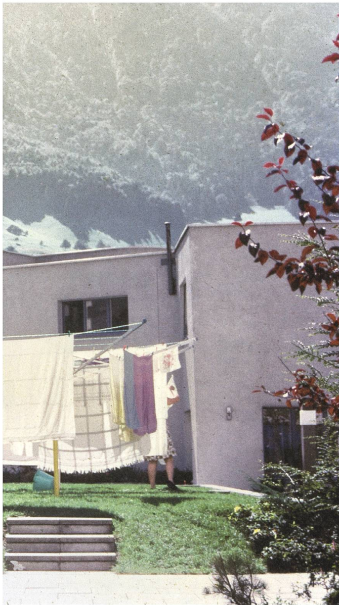
... viel Licht in den Hof.