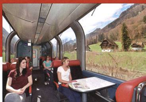
Panoramawagen nach Engelberg