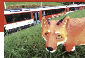
Brünig-Safari von Mai bis Oktober