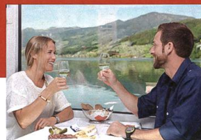
Gemütliches Bistro nach Interlaken