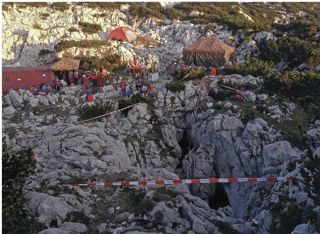
Der Einstieg ins Riesending: Mit einem Plastikband gekennzeichnet.

werden grosse Schwierigkeiten zu bewältigen haben: Steinschlaggefahr in den Schächten, unterirdische Bäche und Wasserfälle, die bei starkem Regen oder Gewitter ein Durchkommen verhindern könnten. Kommen die weiten Distanzen und die grosse Tiefe hinzu. Zusammen mit einem Höhlenretter aus der Ostschweiz übernimmt Siegenthaler die Einsatzleitung rund um die Uhr. Alle 12 Stunden wechseln sie sich ab. Denn inzwischen sind Retter Tag und Nacht in der Höhle