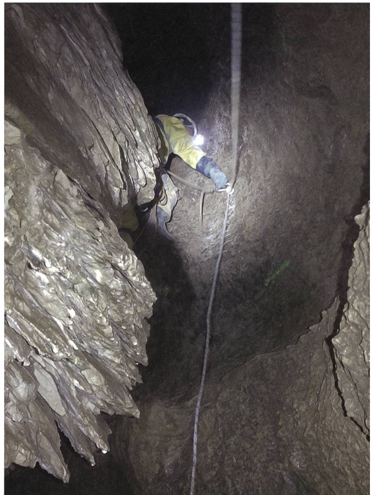
Beim Einrichten in der Traverse oberhalb von Biwak 2.

Lea und ihre Kollegen, die EG3, gehen weiter, fast eine Stunde lang. Schritt für Schritt tasten sie sich durch den Mäander, lagern das Gewicht vom einen Fuss auf den andern und halten sich an den nassen, glitschigen Wänden. Dann steigen sie weiter ab bis unterhalb von Biwak 2 auf mehr als 500 Meter unter Tag. Sie kommen dabei an Orten vorbei, deren Namen Bände sprechen: