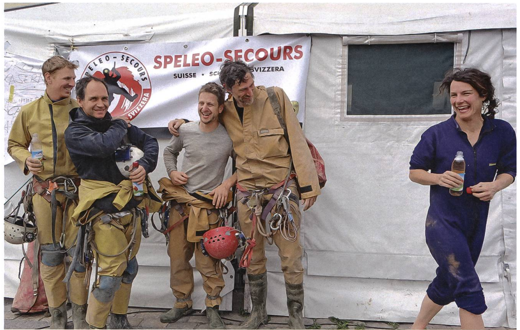
Grosse Erleichterung nach dem Einsatz: Zurück in Berchtesgaden.

Am 25. Juni findet in Bern ein Debriefing der Schweizer Höhlenretter statt. Mehr als 20 Höhlenretter nehmen daran teil, auch Lea und die Einsatzleiter sind da. Siegenthaler hält Rückschau und kündigt eine internationale Tagung an. Man will aus dem Fall lernen und die Strukturen in den verschiedenen Ländern unter die Lupe nehmen.