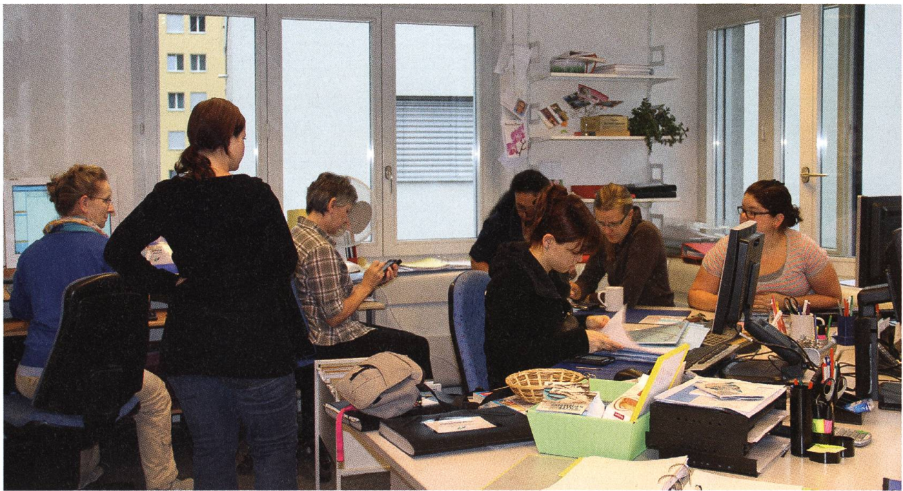
7:05 Uhr: Eine kurze Viertelstunde sind die Spitex-Mitarbeiterinnen unter sich.

Hör-, Seh- und Gehhilfen bestimmen das Angebot am Stanser Herbstmarkt im Jahr 2030. Die vorherrschende Haarfarbe der Besucherinnen und Besucher ist grau. Man diskutiert neuste Modelle von Stützstrümpfen und Rollatoren. Besondere Aufmerksamkeit erhält ein sonnenbetriebener Rollstuhl. Kapslipistolen und Gummidinos hingegen gibt es nur mehr an zwei Verkaufsständen. Eine eigenartige Vorstellung? Nein! In gut 15 Jahren wird ein Drittel der Menschen im Kanton Nidwalden über 65 Jahre alt sein. Das sind doppelt so viele wie heute. Es wird deshalb immer mehr Menschen geben, die auf einfache Hilfsmittel im Alltag angewiesen sind, damit sie unabhängig und selbstbestimmt zu Hause leben können. Viele andere werden Hilfe und Pflege von aussen benötigen.