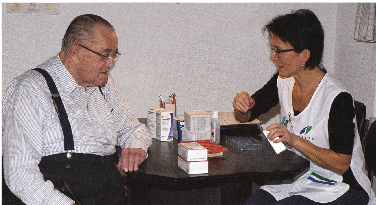
Medikamente für eine ganze Woche. 10 Minuten für das Bereitstellen und für ein Gespräch.

7:25 Uhr: Pflegefachfrau 1 checkt sich auf dem Pocket ein und klingelt an der Haustür. Herr A. liegt auf dem Sofa und hört Radio. Ein vertrauter Gruss, dann bindet sich die Pflegefachfrau die weisse Spitex-Schürze um. Die Blutwerte sind gut, das Insulin wird entsprechend gespritzt. Die Wunde sieht gut aus. Pflegefachfrau 1 rasiert die Bartstoppeln weg, die Herr A. wegen seiner Sehbehinderung nicht erwischt hat. Damit hat sie den Einsatz beendet. Sie zieht die weisse Schürze aus und steckt sie in den Rucksack.