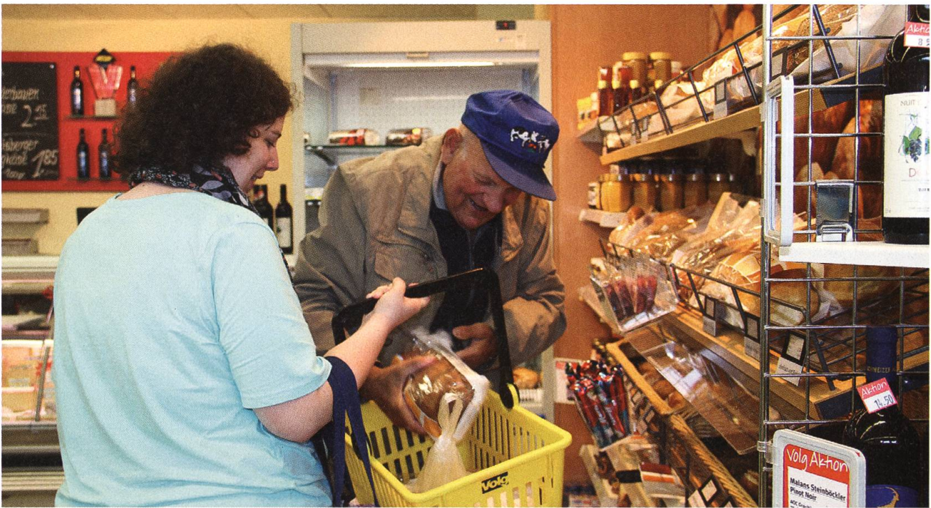
Hinein ins Körbchen. Die Spitex-Betreuerin begleitet den Klienten bei seinen Einkäufen.

starre Leistungsprogramm und die mangelnde Zeit sind Klagen, die man hört. Ausserdem wünschen die Klientinnen und Klienten zeitliche Verbindlichkeiten statt Zeitfenster.