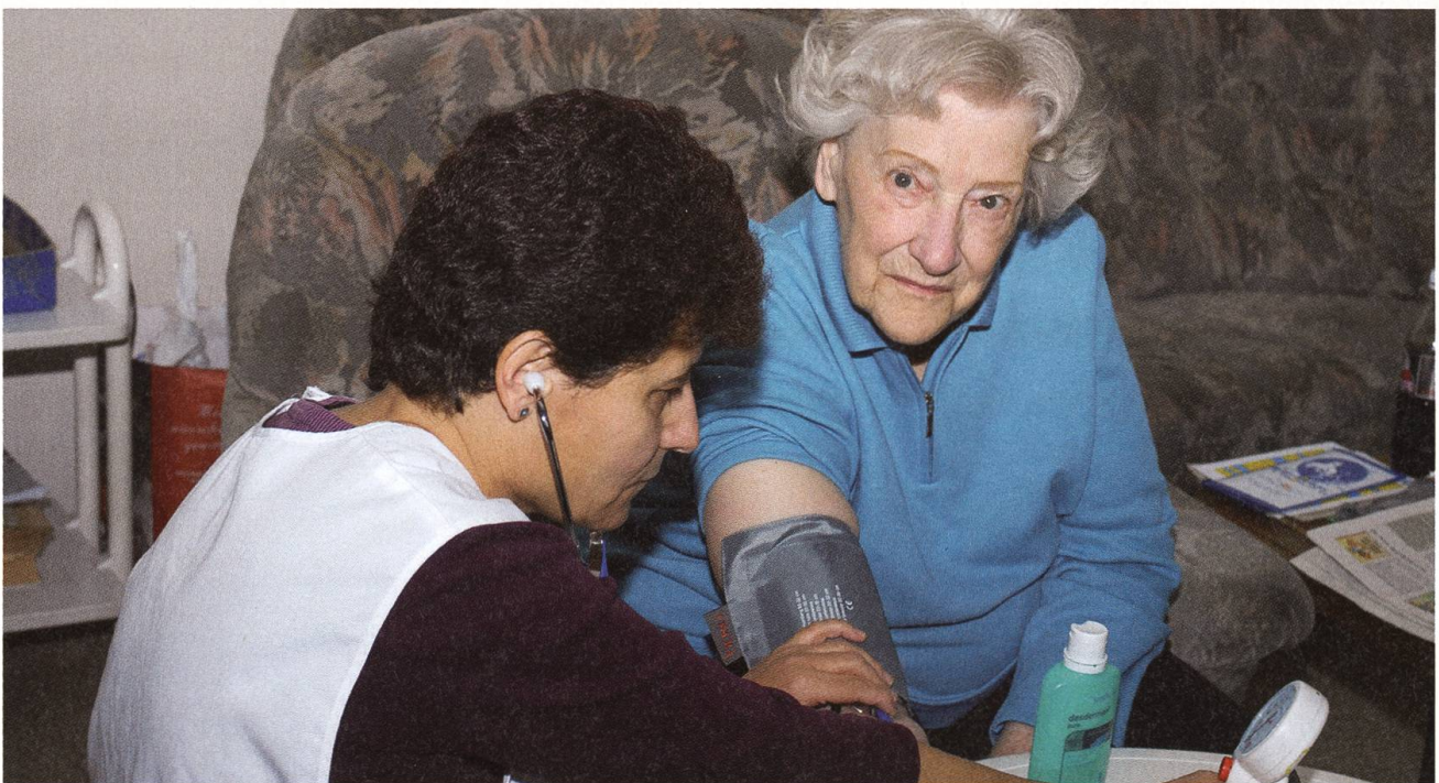
Der Blutdruck: Ist er zu hoch, ist Handeln angesagt.