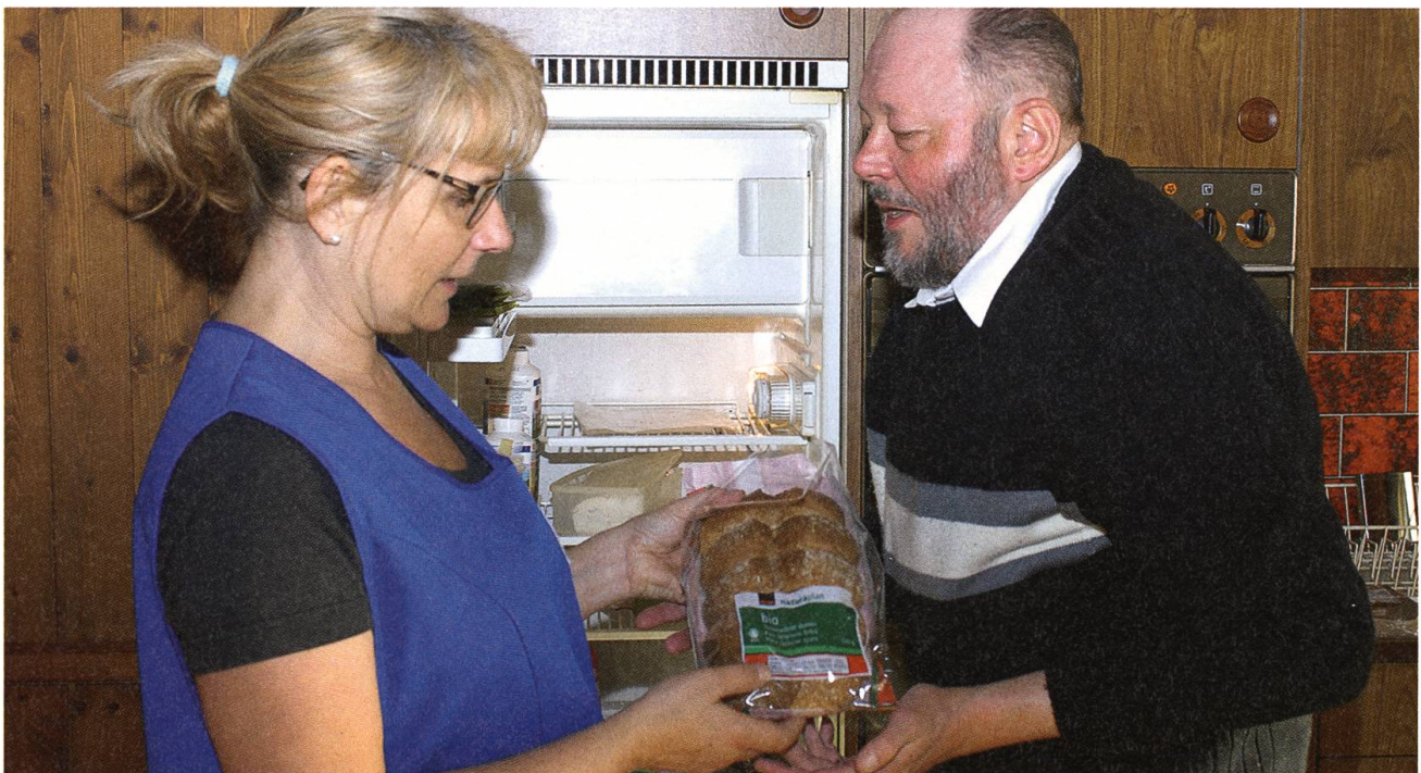
Den Käse in den Kühlschrank oben links, das Tessinerbrot in den Brotkasten. Wer blind ist, muss Ordnung halten.

Eine schwierige Aufgabe! Vor allem die Konstanz bereitet der Spitex Mühe, da die meisten Mitarbeiterinnen Teilzeit arbeiten. Was zu Klagen führt: zu häufig würde das Personal wechseln. Nicht alle Leute zeigen sich zufrieden mit der Spitex. Das