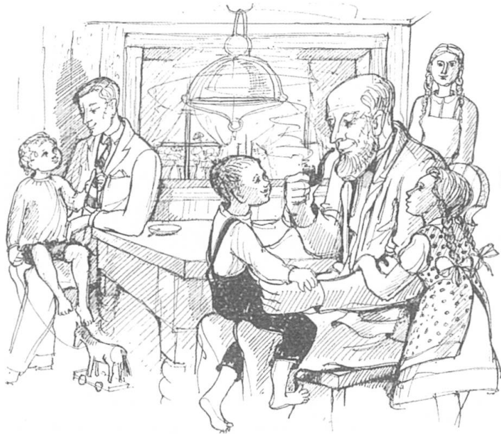
Die Kinder fletterten den beiden Männern auf die Knie.