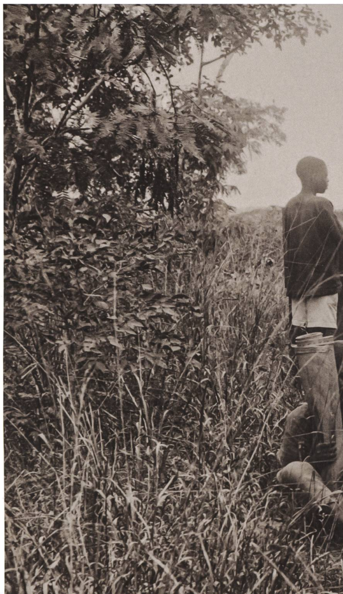
Die Vorhut der vielköpfigen Trägerkolonne bei einer Rast im Busch.