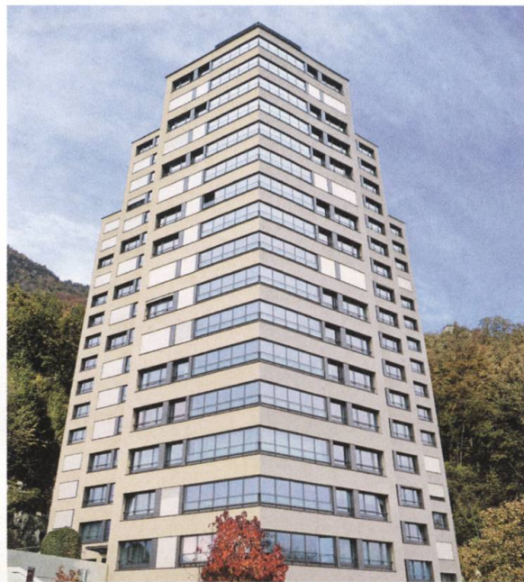
Hochhaus Schiller, Brunnen