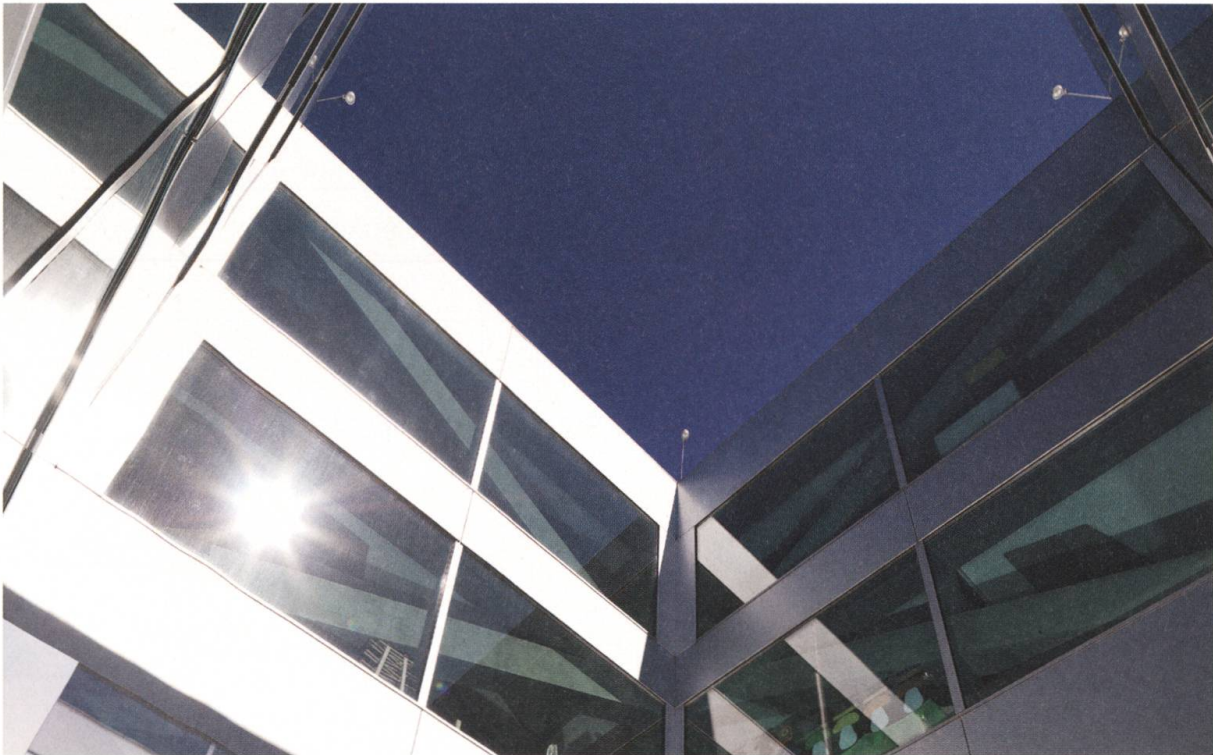
Schulhaus Turmatt, Stans

Firma in den Betrieb ein und übernahmen diesen in Co-Leitung 1991. Bis heute führen sie die Gebr. Leuthold Metallbau AG mit Umsicht und Traditionsbewusstsein, entwickeln die Firma aber gleichzeitig mit Innovationskraft und höchster Qualität weiter. Inzwischen ist der Betrieb mit 30 Mitarbeitenden und rund 5 Millionen Franken Umsatz jährlich auf Leichtmetall-Konstruktionen im Zusammenspiel mit Glas spezialisiert. Bodenständige, in ihrer Heimat Nidwalden tief verwurzelte Handwerker sind sie trotzdem geblieben.