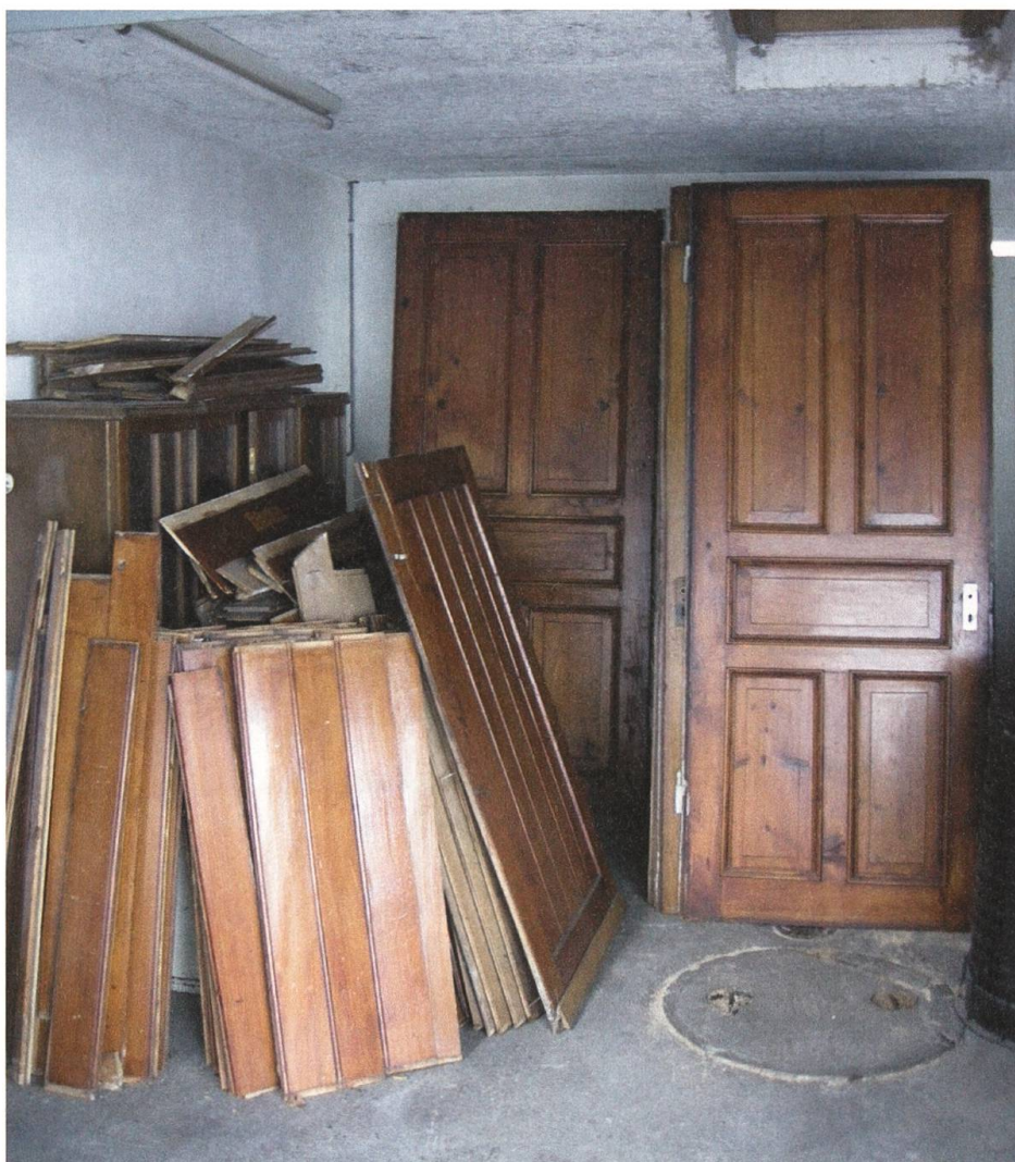
Die Nachnutzung von historischen Bauteilen hat eine weitreichende Tradition. Wandtäfer und Türen stehen in einer Garage zum Weiterverkauf bereit.

Für das Objekt Vorder Breiten hatte das entsprechende Folgen. Eine Unterschutzstellung wurde 2009 unter anderem nicht möglich, weil die originale Ausstattung fehlte und das Haus einen ärmlichen Eindruck hinterliess. Obwohl der Untersuch ein Baujahr um 1450 feststellte und der Grundriss original vorhanden war, hatte das Haus keine Chance. Nur die vom Gebrauch der Jahrhunderte gezeichnete Eingangstüre mit dem typischen Eselsrücken hatte sofort Gefallen gefunden. Ein wortkarger Händler hat sie sorgfältig ausgebaut.