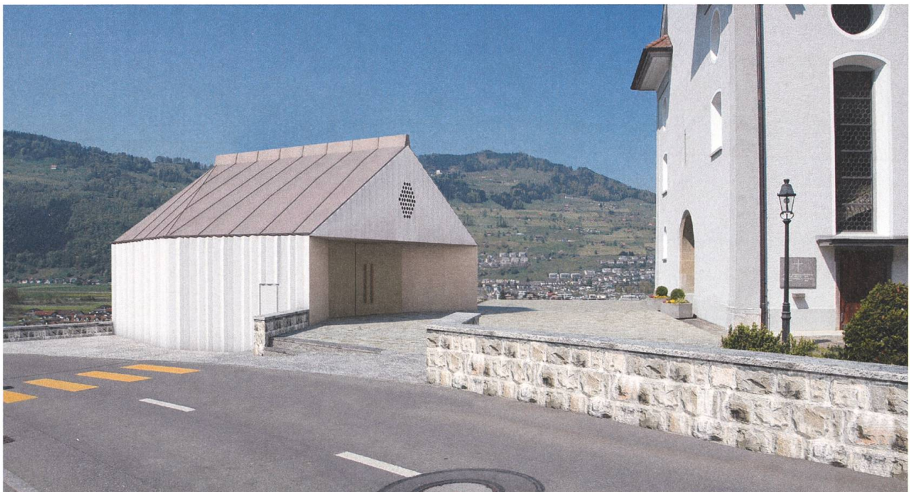
Ersatzneubau Totenkapelle Buochs: Die klare Typologie lässt sofort die Verwandtschaft zu sakralen Bauten erkennen. Die Gliederung in Raumfolgen übernimmt Themen der Pfarrkirche von Buochs.

Tatsache ist, dass heute ganze Interieurs aus Gründen eines besseren Wärmeschutzes zerstört werden. Wo aus Rücksichtnahme auf das Ortsbild die Nachisolation nicht aussen aufgetragen werden kann, wird zwangsläufig auf den Innenraum