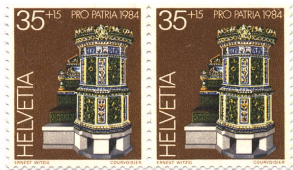
Der Ofen der Visitenstube war Sujet der 35+15-Rappen-Marke von Pro Patria im Jahr 1984. Er ist einer der ältesten, vollständig erhaltenen Kachelöfen der Schweiz und steht im Landesmuseum Zürich.