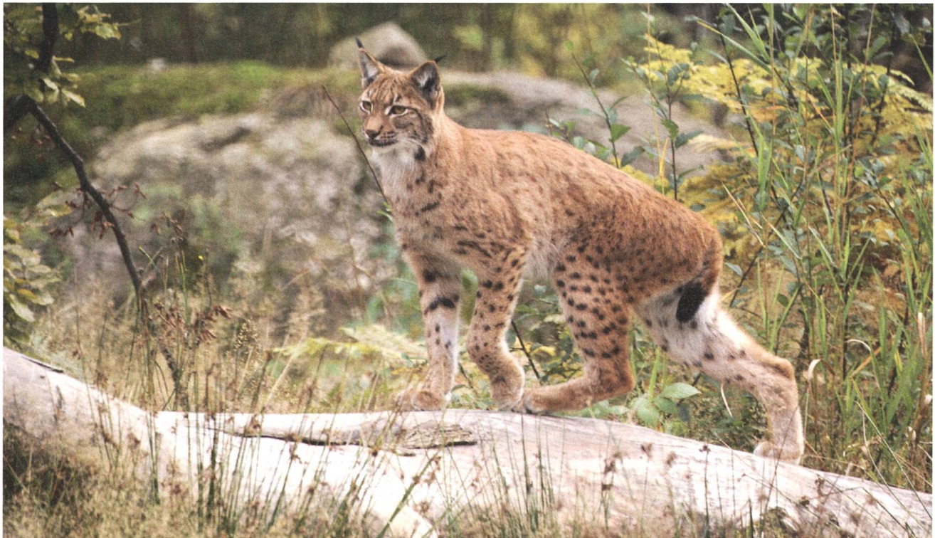
Auf eben so leisen wie flinken Pfoten unterwegs: Ein Luchs in Nidwalden.

Was Niederberger nun erlebte, wird er nie mehr vergessen: An der Seite einer seiner Anglo-Nubian-Ziegen hing ein junger Luchs. Der hatte wohl versucht, das Haustier zu töten. Weil aber bei dieser Ziegenrasse die Ohren herunterhängen, hatte