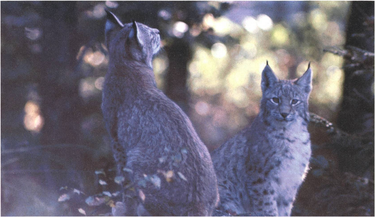
Ein Luchsweibchen nimmt sein fast ausgewachsenes Junges mit auf die Jagd.

geworden. Doch Leo Lienert machte sich keine Sorgen. «Ich glaube nicht, dass der Bund angesichts des erfolgreich verlaufenden Versuches mit einer sichtbaren Erholung der Wälder einer Luchsjagd jemals zustimmen wird», sagte er. Der letzte Entscheid liege ohnehin bei den Kantonen.