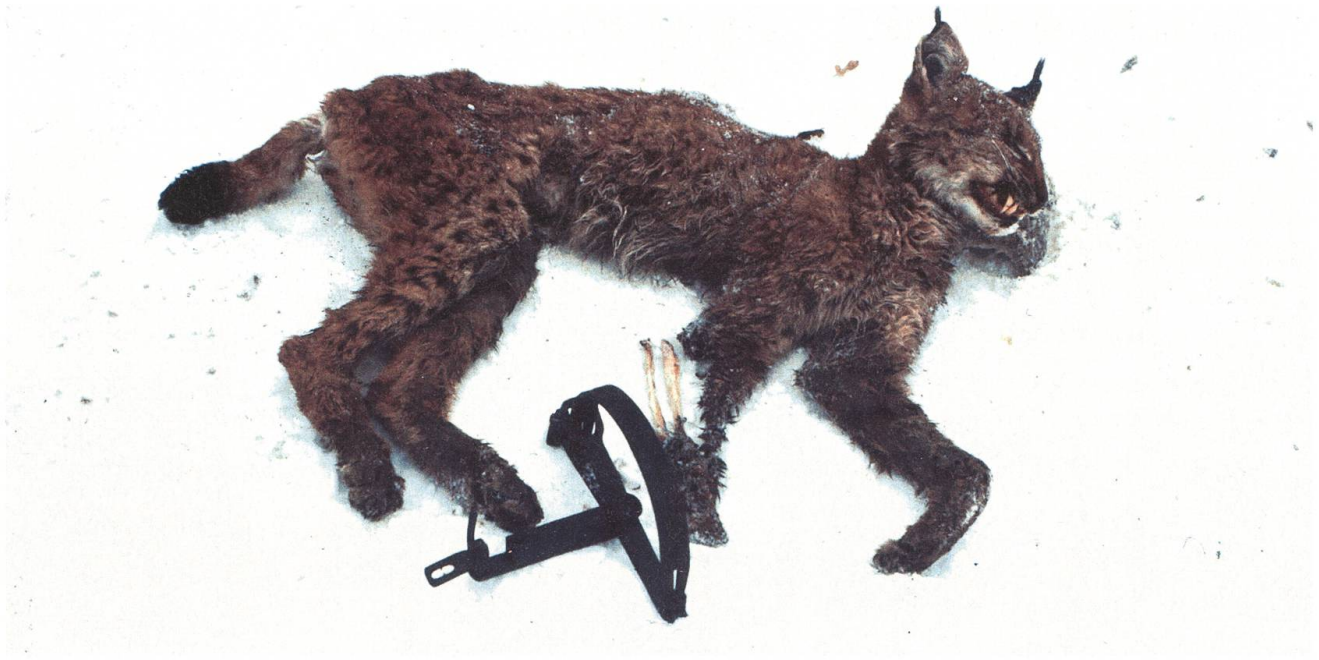
Der mit einem verbotenen Tellereisen erlegte Luchs von Alpnach schockierte sogar die Jäger.

führte. Nun machten sie auch Luzern, Uri und das Berner Oberland zu ihrem Revier. Das aber führte zu neuen Diskussionen, denn da und dort wurden nun vom Luchs gerissene Lämmer gefunden. Neben den Jägern traten deshalb mehr und mehr auch die Schafzüchter als Luchsgegner in Erscheinung.