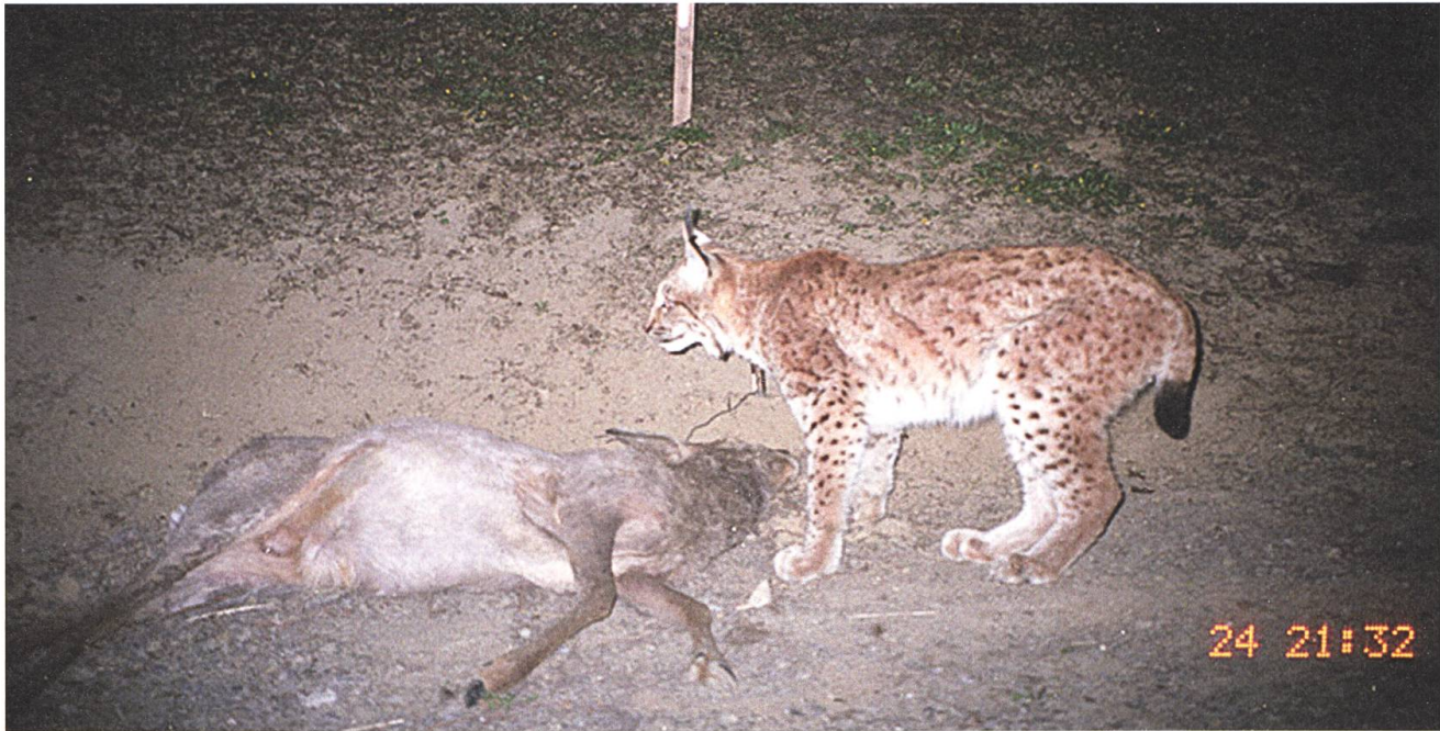
Wiesenberg: Luchs B99 ist zu seinem gerissenen Reh zurückgekehrt.