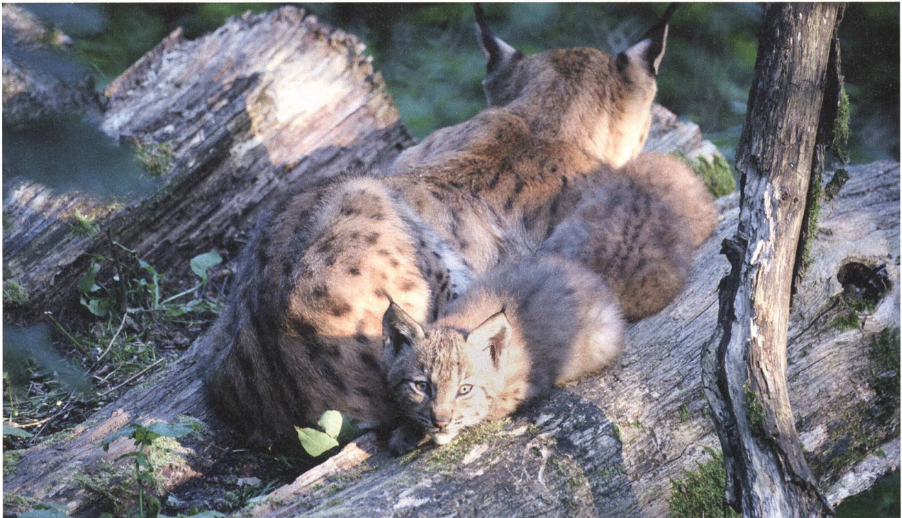
Ein Bild mit Seltenheitswert: Mutter mit Jungtier.

Die einzigen, die von diesen Streitereien unbehelligt blieben, waren die Luchse: Sie fühlten sich in ihrer neuen Heimat wohl und vermehrten sich, was zu einer Ausweitung der Population