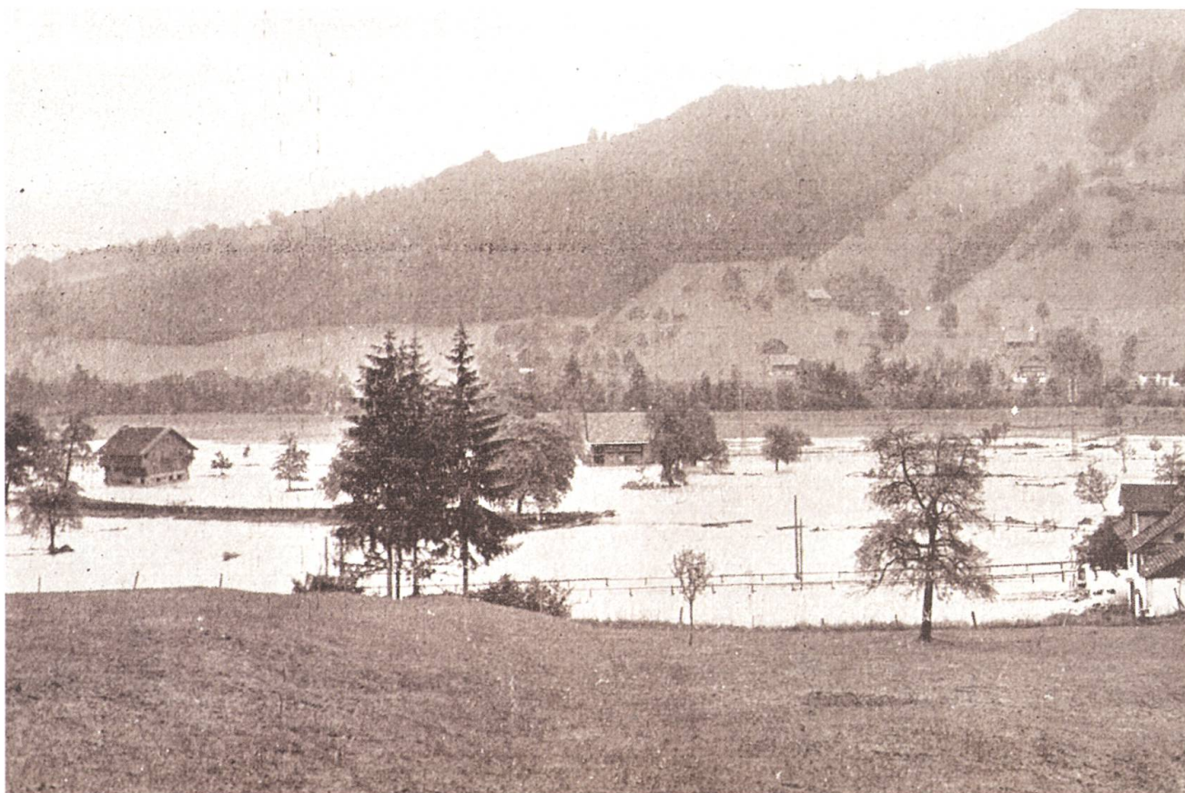
Überschwemmt: Das Gebiet Blätterli in Oberdorf.

Selten ist ein Vorsommer so schön und fruchtverheissend über dem Stanserboden aufgegangen, nie war das Heu so üppig in den fruchtbaren Matten gestanden wie im Jahre 1910. Wer hätte es gedacht, dass wir diese Jahreszahl in die Unglückschronik unseres Landes eintragen müssten. Nach mehr als einem halben Jahrhundert hat das Aawasser wieder einmal den Boden betreten, den es in Jahrtausenden selbst gebildet hatte. Am 15. Juni 1910 hat es sein Anrecht auf dieses Stück Boden, den Arbeit und Fleiss der Menschen zu einem Paradies gemacht haben, mit unwiderstehlicher Gewalt, mit einer Kraft, vor der wir staunten und zitterten, wieder geltend gemacht.