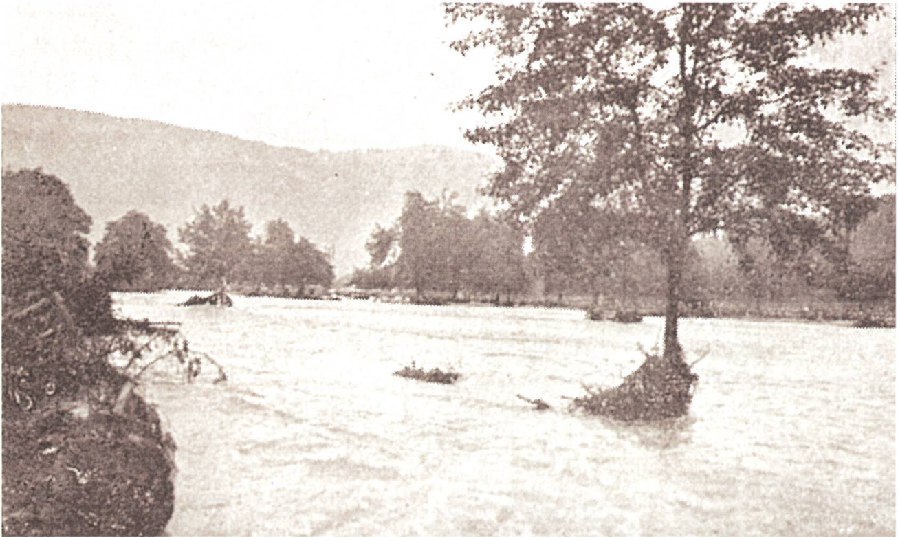
Ein reissender Strom: In Oberdorf tritt die Engelbergeraas breit über die Ufer.

die Gefahr bestand, dass ein Wasserlauf sich dem Dorfe zuwenden könnte, wurde mit allem möglichen, gerade zur Hand liegenden Materialien verbarrikiert, und so gelang es glücklicherweise, Dorf und Bahnhofplatz von der Überschwemmung frei zu halten.