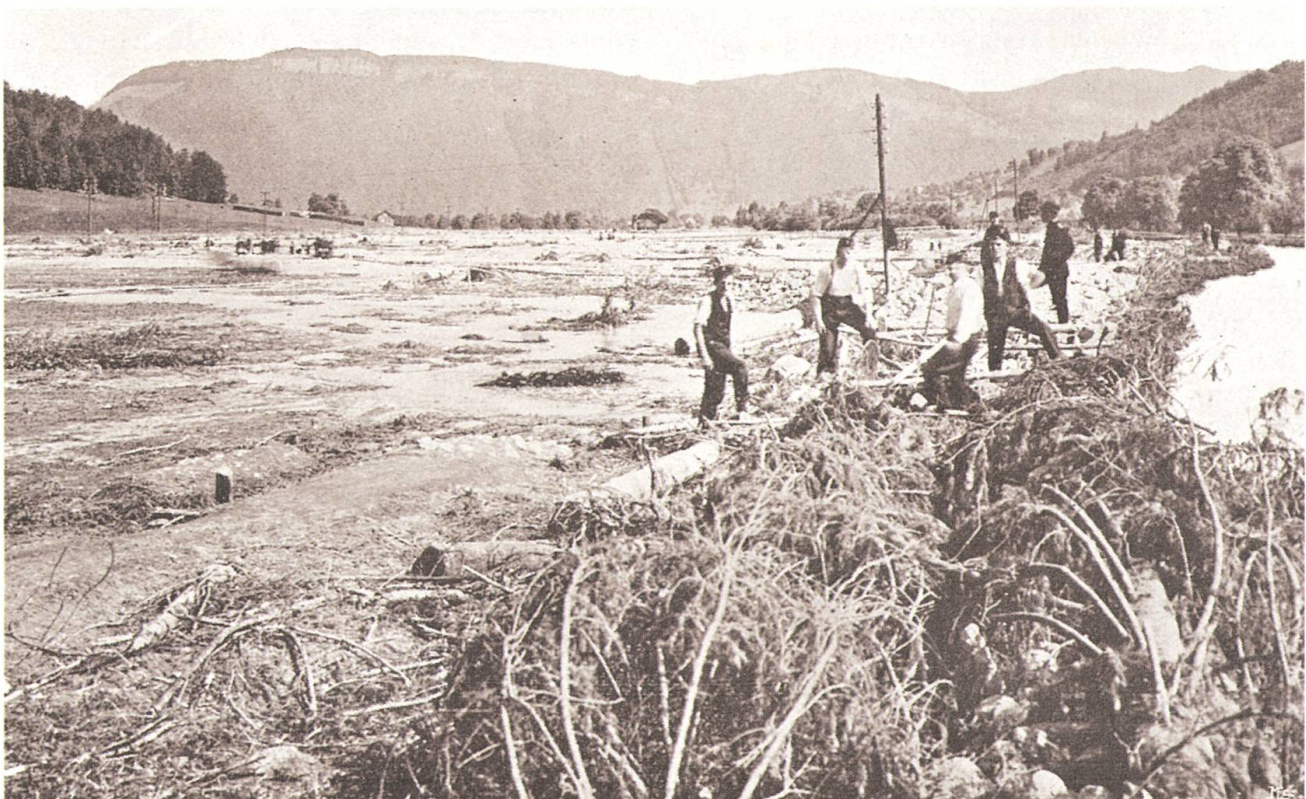
Freiwillige Helfer erstellen einen Notdamm, um die Allmeind zu schützen.

Die Männer, die am 15. Juni morgens früh am Aawasser standen, sagen, dass sie vor der Riesen-