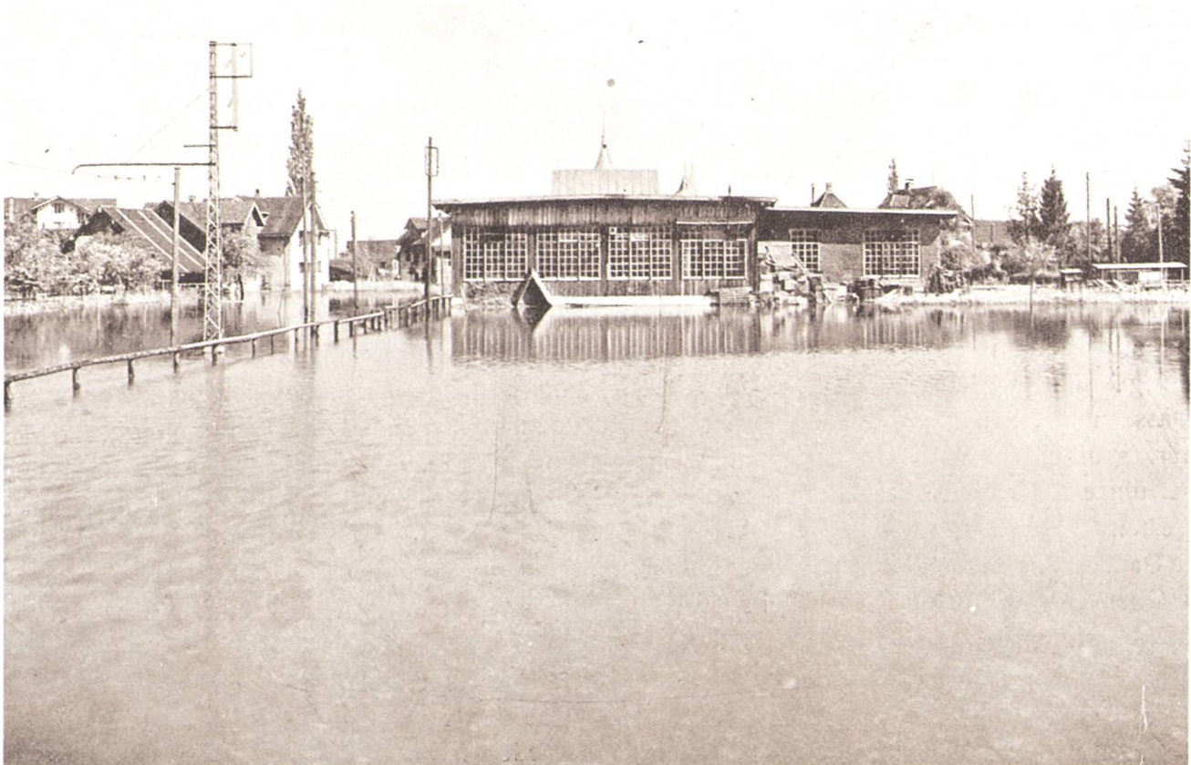
Knietief geflutet: Der obere Teil von Stansstad.