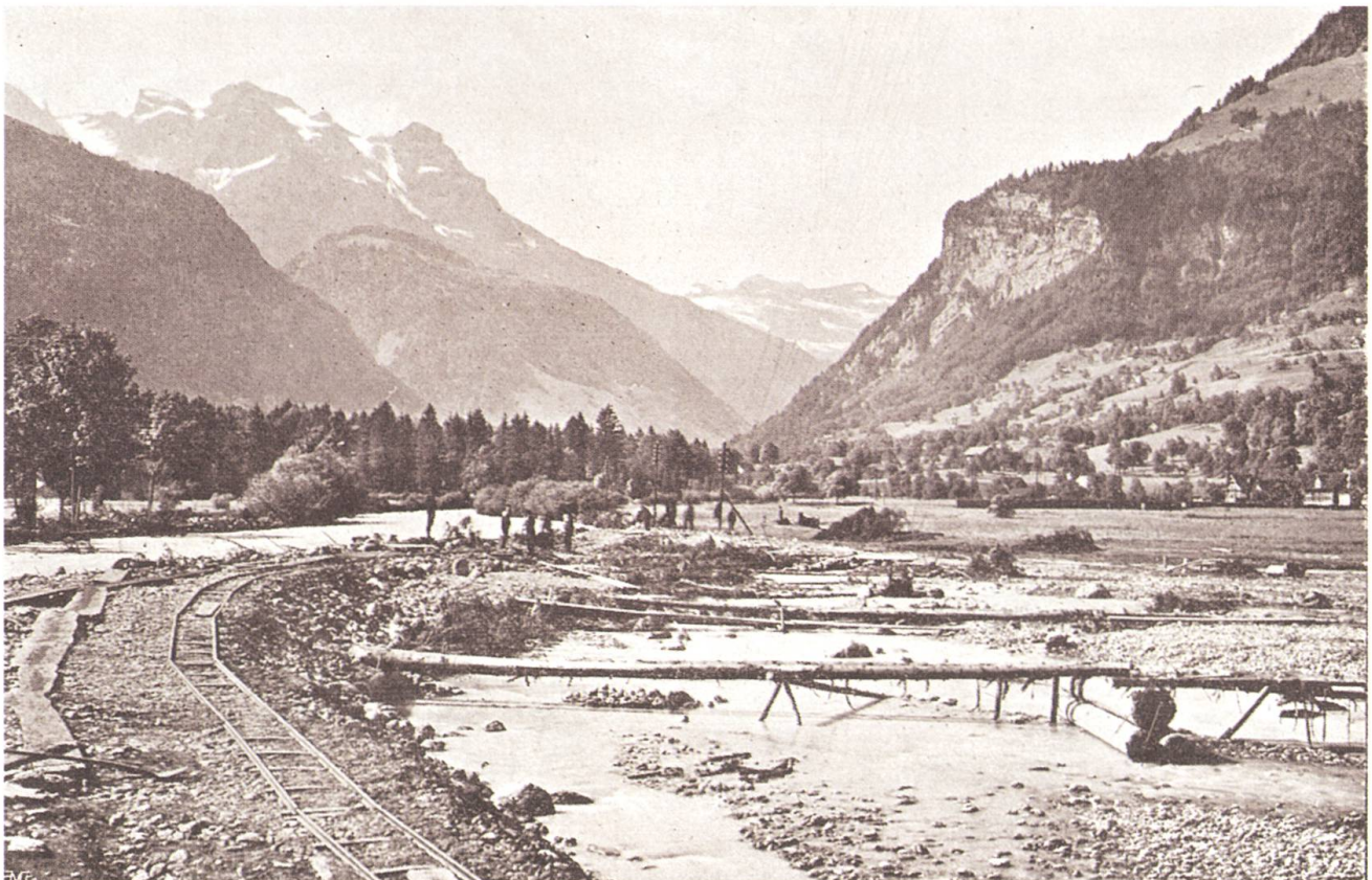
Parforce-Leistung: Der fertige Notdamm.

Furchtbar hat das Uferdörfchen Stansstad gelitten. Von zwei Seiten war es bedrängt: vom hohen Wasserstand des Sees und von dem neuen Lauf der Aa; diese fiel das Dorf im Rücken an und bedrohte die Häuser. Dank der soliden Bauweise der alten Unterwaldner haben die Häuser, die tagelang mitten im Strome standen alle standgehalten. Schon am Vormittag stand Stansstad im Wasser. Die Flut umschloss enger und enger jedes Gebäude, der Seedruck drang in die Erdgeschosse ein. Die am Mittwoch auf dem Dorfplatz errichteten Notstege waren am Donnerstag morgen von dem höher steigenden Wasser gehoben und unbegehrbar gemacht.