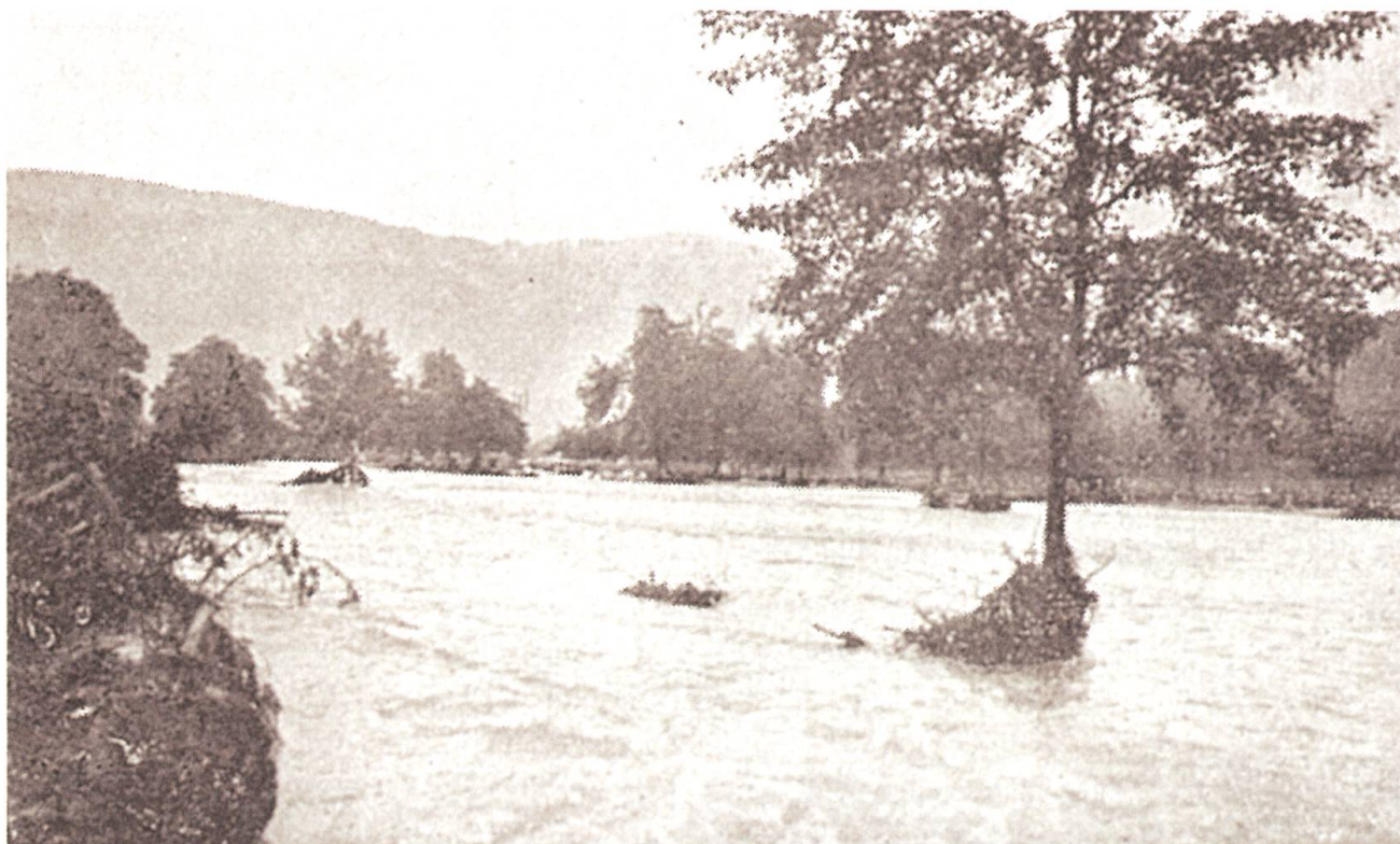
Ein reissender Strom: In Oberdorf tritt die Engelbergeraä breit über die Ufer.

die Gefahr bestand, dass ein Wasserlauf sich dem Dorfe zuwenden könnte, wurde mit allem möglichen, gerade zur Hand liegenden Materialien verbarrikadiert, und so gelang es glücklicherweise, Dorf und Bahnhofplatz von der Überschwemmung frei zu halten.