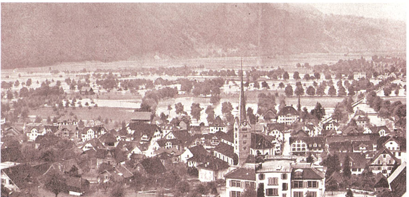
Deprimierender Anblick nach der Flut: Weite Teile des Stanser Bodens sind unter Wasser gesetzt.

Die Sturmglocken riefen die Rettungsmannschaft an die Arbeit. Es war halb 7 Uhr, als sie in Stans zum ersten Mal ertönten. Der Dorfplatz war vom Winkelrieddenkmal bis zum Brunnen hoch und breit mit Schutt und Geröll bedeckt, welches ein stark angeschwollener Bergbach von der «Lau» am Stanserhorn her neben dem Kreuzegg vorbei