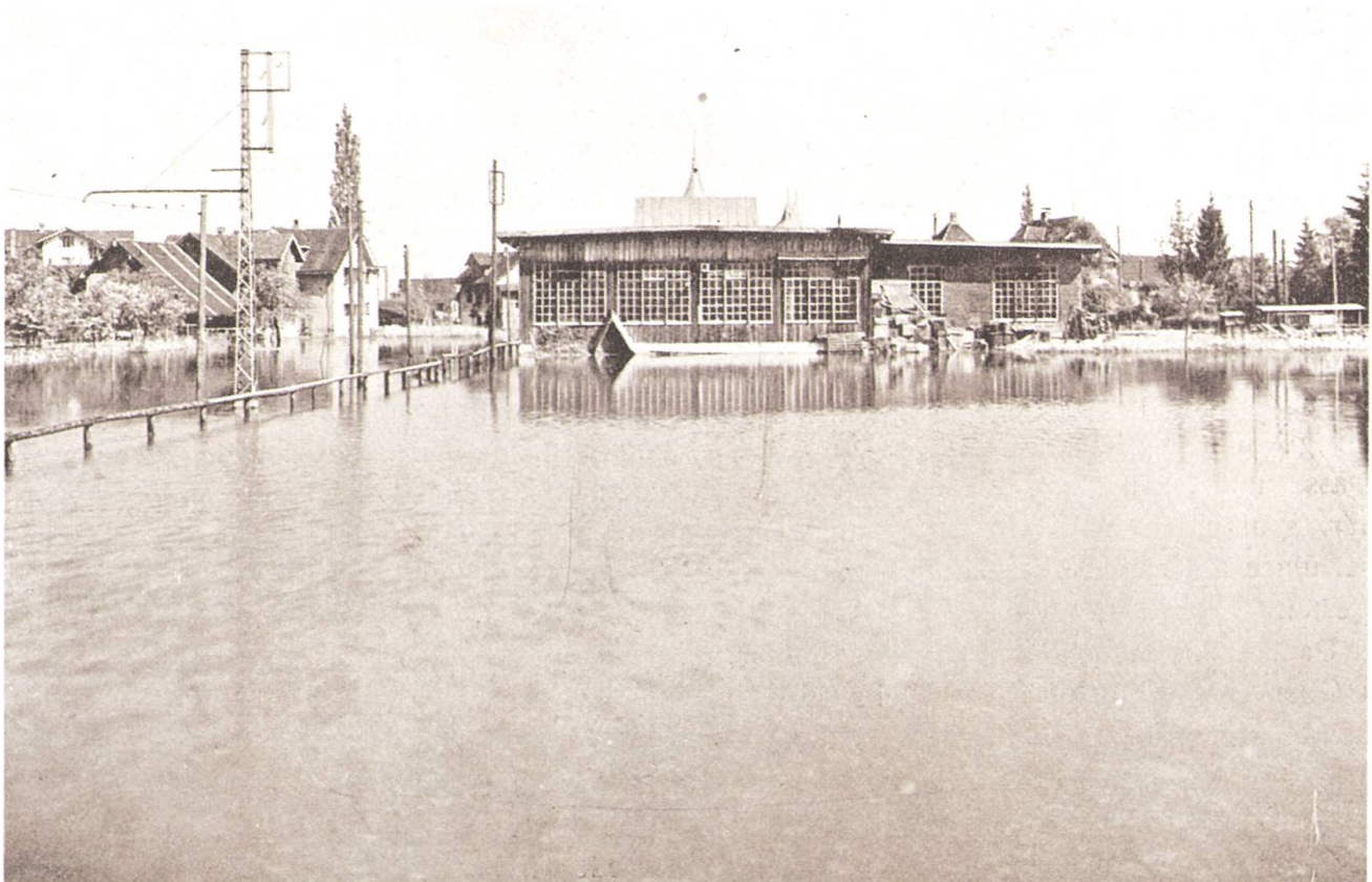
Knietief geflutet: Der obere Teil von Stansstad.