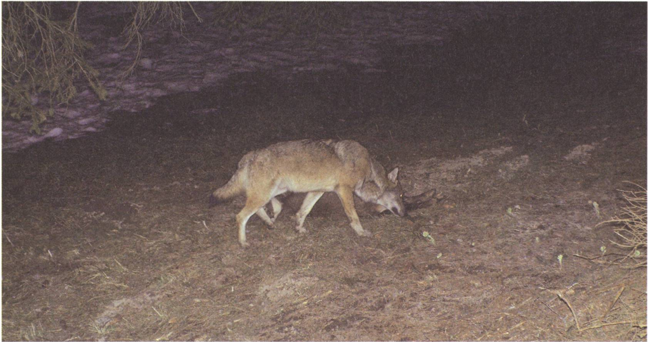
Das ist wahrscheinlich auch «unser Wolf»: Am 14. April 2009 tappte er in eine Fotofalle im Eigenthal.