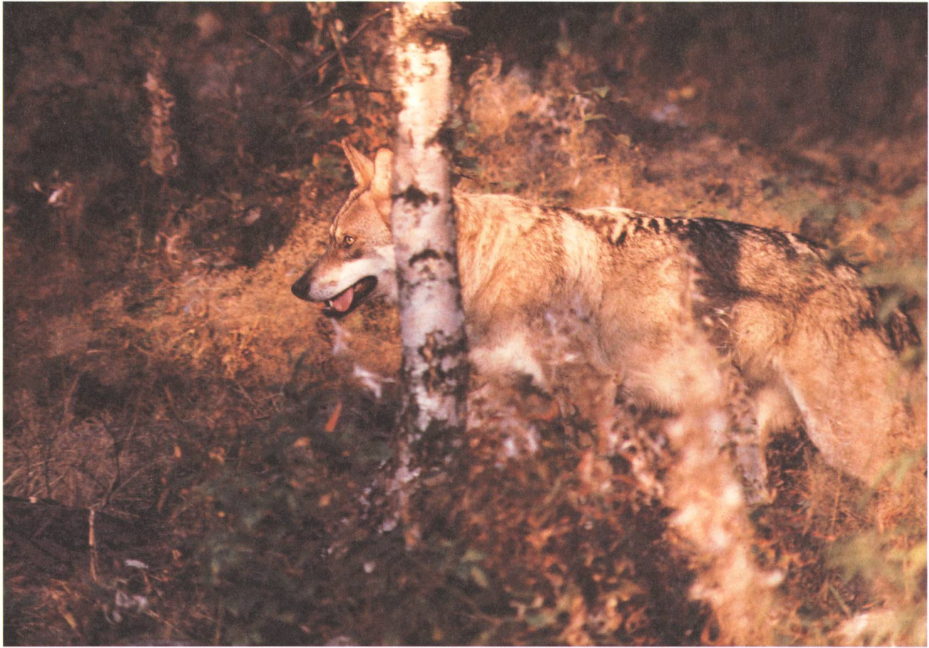
Freilebende Wölfe wie hier in Osteuropa sind in der Natur gut getarnt und gegenüber den Menschen sehr scheu.

Wölfen gelebt und ihr Verhalten studiert. Er ist von ihnen akzeptiert und als eine Art Oberwolf behandelt worden. Die gleichen Wölfe blieben aber andern Menschen gegenüber misstrauisch. Also mussten sie mindestens ihn, den Wolfsforscher, persönlich erkannt haben.