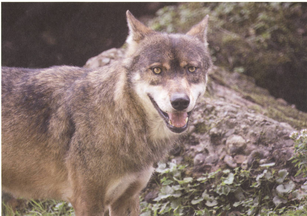
Sieht gefährlich aus, ist aber sicher hinter Gittern: Ein europäischer Wolf im Gehege des Tierparks Goldau.

welcher die Vereinigung Pro Natura in der Nidwaldner Jagdkommission vertritt, hält wenig von Abschüssen: «Der Wolf ist ein Teil unserer Natur und Kultur», meint er. Und dieses Tier, das an der Spitze der Nahrungspyramide stehe, spiele auch eine wichtige Rolle für ein gut funktionierendes Ökosystem. Der Wolf sei nämlich das Gegenteil eines Trophäenjähgers, er würde immer zuerst schwache und kranke Tiere erbeuten. Wo er sich nicht an Nutztieren vergreife, werde er vor allem Rotwild erbeuten.