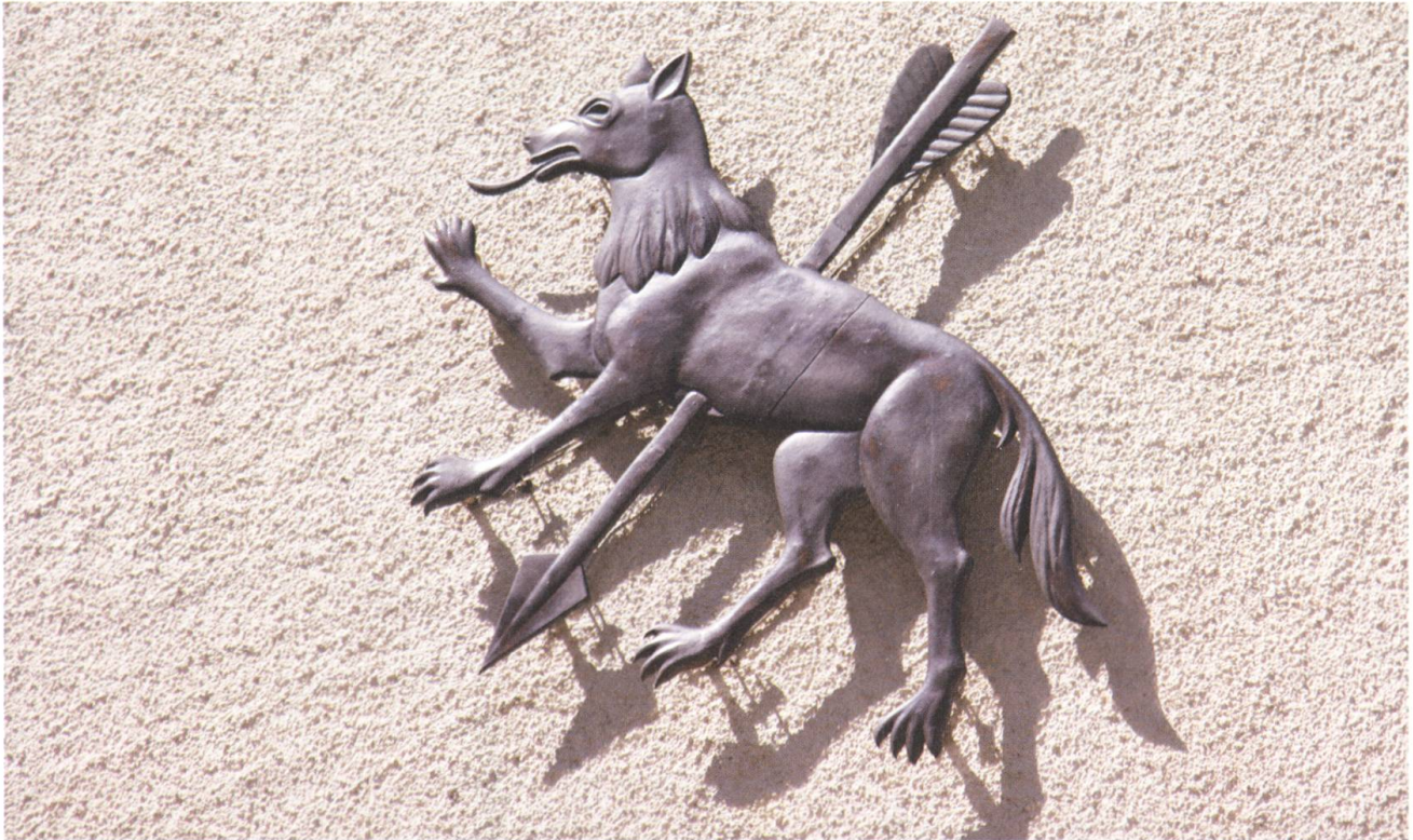
Das Gemeindewappen von Wolfenschiessen basiert auf einem Missverständnis.

vor allem die Besitzer von Klein- und Grossvieh gefordert sind. Sie sollen Schäden abwehren. Allerdings werden die Massnahmen, die sie treffen, vom Bund kräftig unterstützt. Das Wolfskonzept legt für die finanziellen Abgeltungen sogenannte Präventionsperimeter fest.