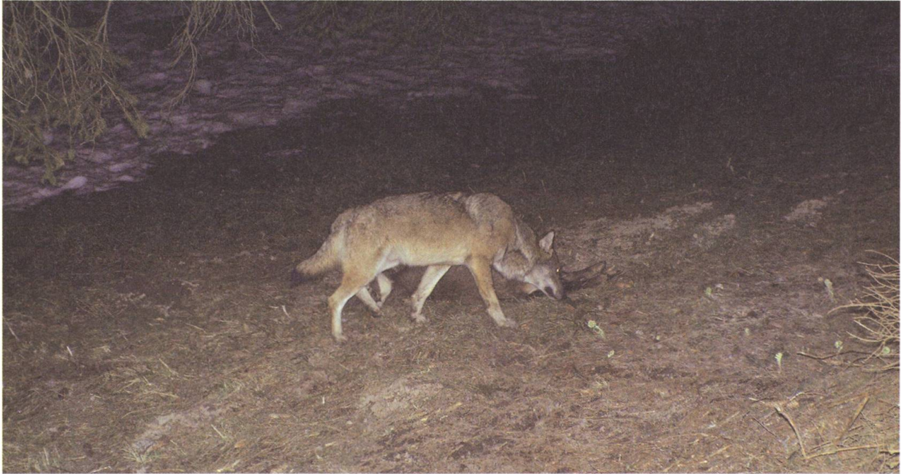
Das ist wahrscheinlich auch «unser Wolf»: Am 14. April 2009 tappte er in eine Fotofalle im Eigenthal.