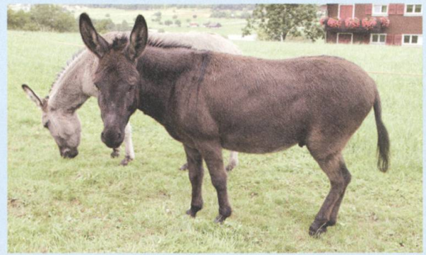
Esel wie hier auf der Pferdepension Pegasus in Buochs werden in Nidwalden leider noch nicht als Schutztiere eingesetzt.