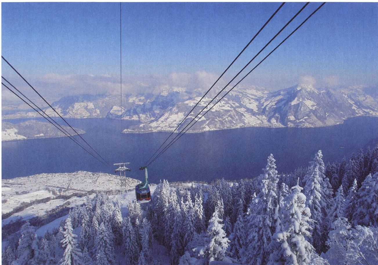
Die Klewenalp im Winter: Ein Paradies für kleine und grosse Schneesportbegeisterte.

Die Schweiz hat 124 Pendelbahnen, 214 Gondelbahnen, 59 Standseilbahnen, 3143 Sessellifte und 1072 Skilifte*. Da kann ja die Klewenbahn wohl nichts Besonderes sein. Falsch geraten! Für Beckenried ist das «Klewenbähnli» etwas Einzigartiges. Es gehört zum Ortsbild wie See und Berge, Kirche und Autofähre. «Eyses Bähnli» sagen die Einheimischen liebevoll – und besitzergreifend. Die Klewenbahn erleichtert ihnen Schul- und Arbeitsweg, sie bringt im Sommer die Älpler auf den Berg und die Milch ins Tal. Und im Winter bietet das Unternehmen willkommene Nebenerwerbsmöglichkeiten: Landwirte und Bäuerinnen bedienen die Skilifte, grillieren Würste, kochen Suppe, servieren an der Schneebar oder fahren mit dem Pistenbully. Mit mehr als 80 Mitarbeitenden ist die Klewenbahn dann einer der grössten Arbeitgeber im Ort.