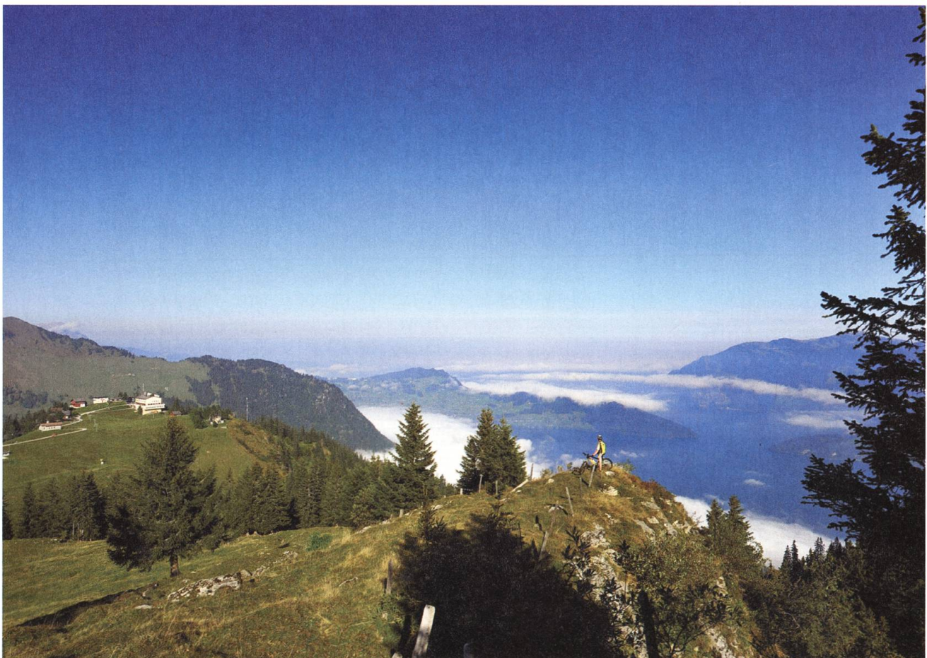
Die Klewenalp im Sommer: Ein Paradies für Wanderer, Familien, Biker, Kletterer, Gleitschirmflieger.

Die Erstellungskosten von 285'000 Franken sollten durch Genossenschaftskapital einerseits und Anteilscheine im Wert von je 100 Franken andererseits beglichen werden. Der Weg war zäh, Auswärtige mussten der Genossenschaft unter die Arme greifen. Doch dann war das Geld beisammen, die Firma Robert Aebi & Cie AG Zürich begann mit dem Bau – und am Karsamstag, den 15. April 1933, konnte die neue Bahn offiziell den Betrieb aufnehmen. Das Aussergewöhnliche an der neuen Anlage waren die Länge von mehr als drei Kilometern, aber auch