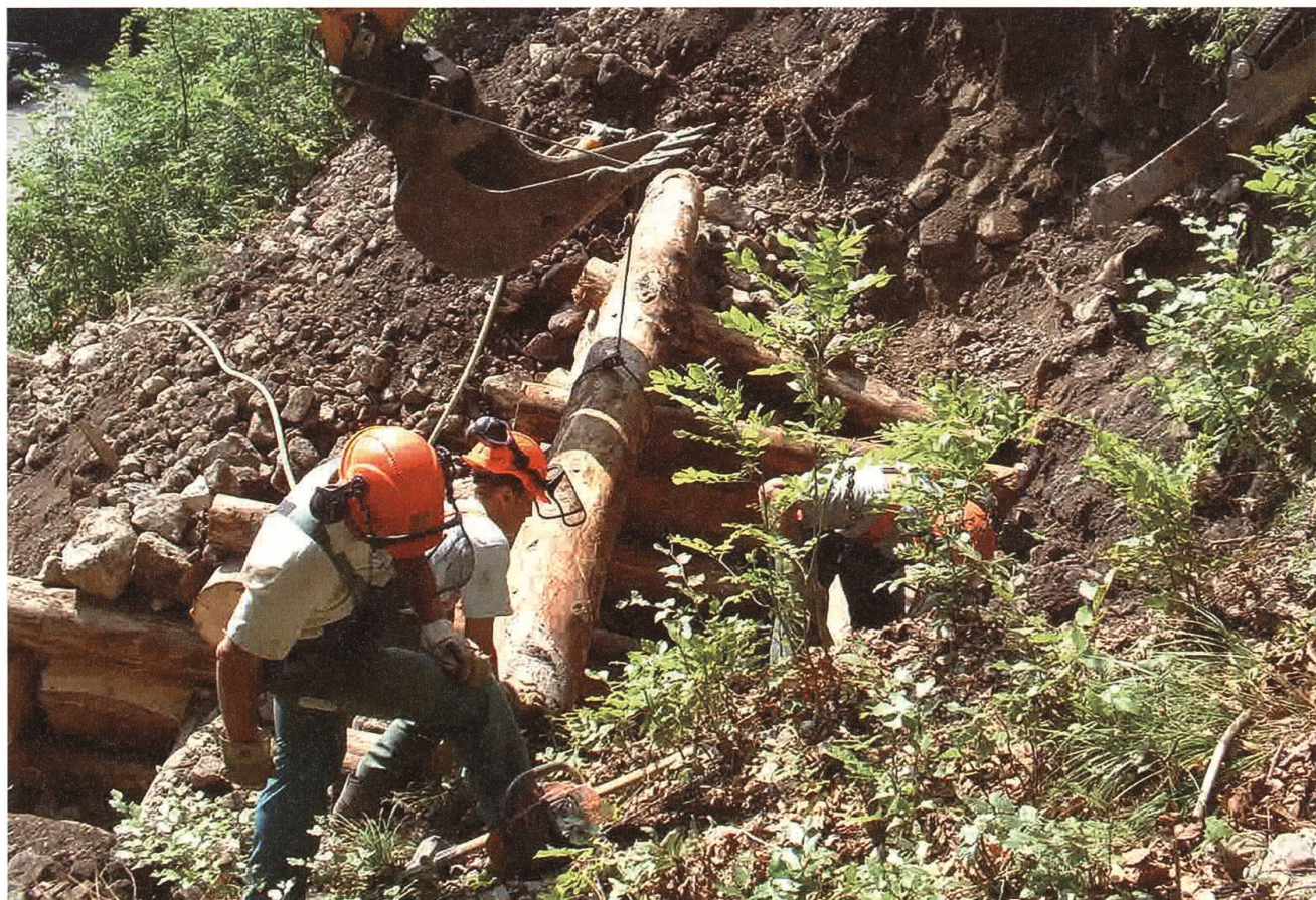
Die Mitarbeiter des Dallenwiler Forstbetriebes der Uertekorporation sind Spezialisten für Hang- und Bachverbauungen.

In den letzten Jahren hat sich der Charakter des Forstbetriebes stark verändert. Zwar gehören die typischen Holzerarbeiten nach wie vor zum Aufgabengebiet der Forstgruppe, aber nicht mehr ausschliesslich. Die Mitarbeiter des Dallenwiler Forstbetriebes der Uertekorporation haben sich zu eigentlichen Spezialisten für Hang- und Bachverbauungen entwickelt. Dies aus gutem Grund: Über all die Jahrhunderte hatten die Bewohner von Dallenwil gegen das Wasser zu kämpfen.