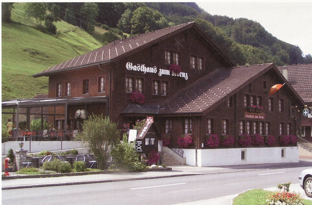
Das Gasthaus «Kreuz» am Dorfplatz, erwarb die Uertekorporation im Jahre 1975 und liess es stilgerecht restaurieren.

Für die Schule und die Kirche hat sich die