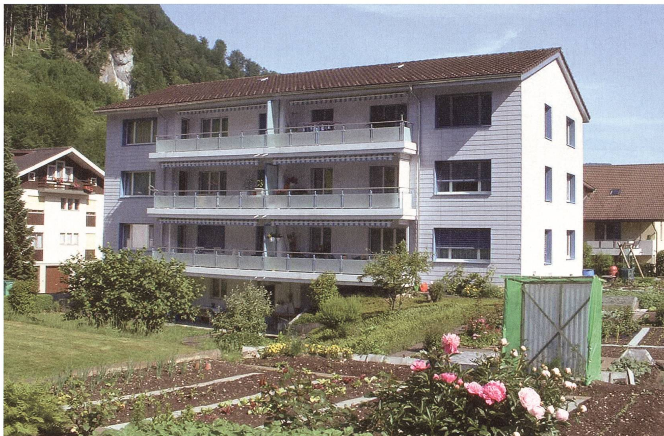
Die Mehrfamilienhäuser an der Allmendstrasse schaffen einen Wert, der über Generationen hinaus bestand hat.

Heute steht das neue Uertizentrum am Dorfeingang von Dallenwil für den Fortschritt der Uertekorporation. Die repräsentative Lage am Dorfeingang ermöglicht es, die Forstwirtschaftsbranche der Bevölkerung näherzubringen. Der Forst spielt nunmehr auch im Dorfleben von Dallenwil eine zentrale Rolle und ist nicht mehr in die umliegenden Wälder verbannt.