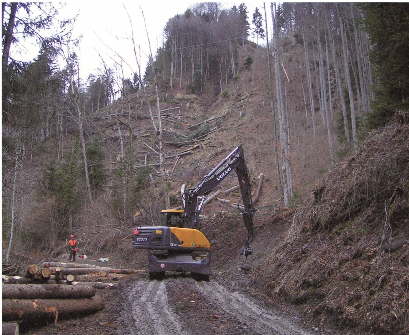
Die Uertekorporation Dallenwil investiert jährlich bis zu 100'000 Franken in die Pflege der Dallenwiler Schutzwälder.

Von Wiesenberg her kommt der Steinibach, und im Talboden hatte bis 1910 die Uertekorporation die sogenannte Wuhrpflicht entlang der Engelbergeraa. Im Jahre 1812 hat der bekannte Ingenieur Conrad Escher von der Linth dem Volk von Dallenwil in seinem Gutachten die grossen Gefahren aufgedeckt, in denen es sich befindet, wenn der Steinibach weiterhin seine Naturgewalt entfessele und möglicherweise den Abfluss der Surenenaa, gemeint war damit die Engelbergeraa, mit Felsgestein und Wurzelstöcken verhindere. Trotz dieser Warnung wurden die Gefahren oben am Berg nicht behoben.