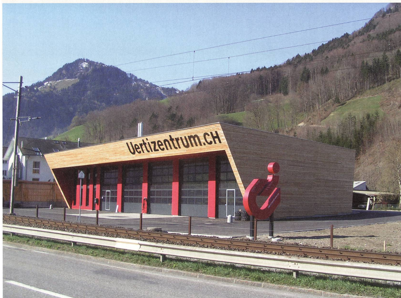
Die repräsentative Lage des neuen Uertizentrums am Dorfeingang bringt die Forstwirtschaftsbranche der Bevölkerung näher.

Daraus ist unter anderem zu entnehmen: «Zu Bauen der Halbteil, auf Oberbauen der Halbteil, die Kernalp ganz, zu Egg der Halbteil, zu Surenen der Halbteil, zwei Teile von Trübsee.» Mit Egg ist dabei die Dallenwiler Alp gemeint, was die Vermutung erlaubt, dass Dallenwil schon damals