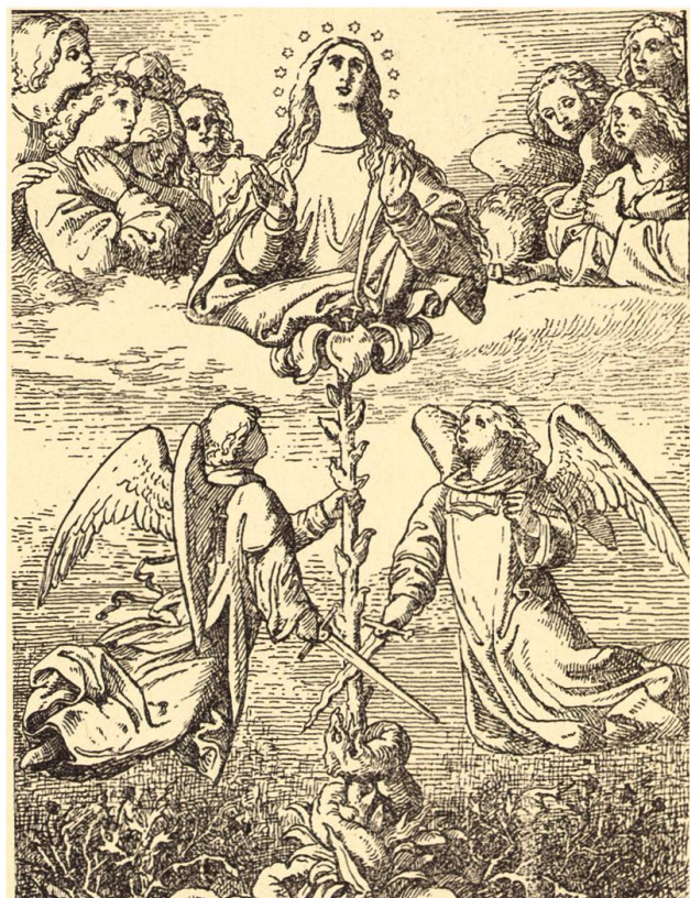
Theraterstücke, eine Karikatur zum aufkommenden Tourismus in Engelberg und natürlich religiöse Themen.