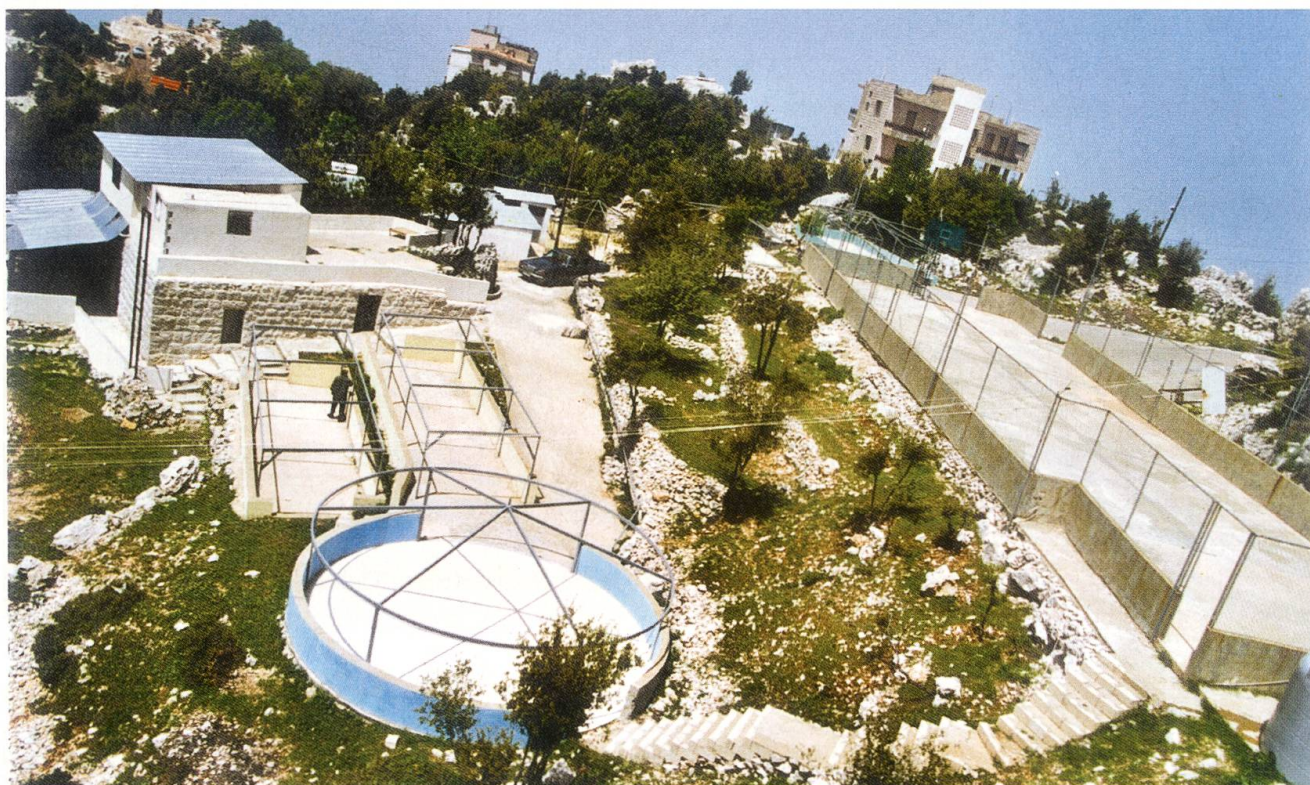
Das 5'000 Quadratmeter grosse Areal vor dem Haus des Friedens. Hier soll ein «Garten des Friedens» entstehen.