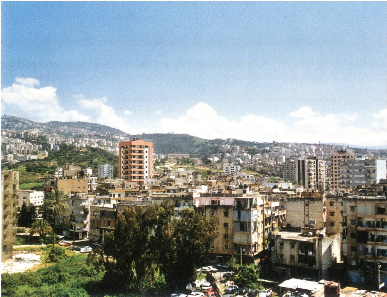
Das Quartier Bauchrieh in Beiruth, wo die Pfarrei St. Jean Baptiste ist.

«Wir leben in einem Zustand chronischer Überarbeitung, unter extremem Stress», erzählt eine andere Lehrerin, die ebenfalls anonym bleiben will. «Es wird von Jahr zu Jahr schlimmer, aber für die meisten Libanesen ist dieser Zustand normal geworden. Ich kenne weit und breit niemanden, der heute noch mit Freude zur Arbeit gehen könnte.» Der Schultag ist für alle erschöpfend. Er beginnt meistens um 7.15 Uhr und endet um 14 Uhr. Für