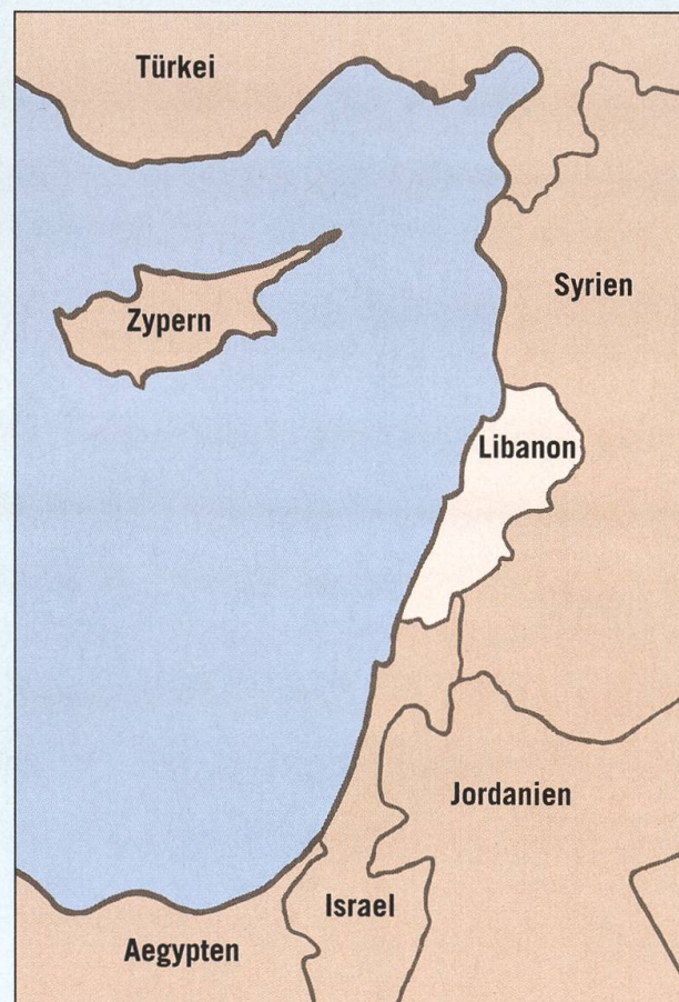
Libanon ist rund ein Viertel so gross wie die Schweiz.

Im Gegensatz zu den verschiedenen Gruppen der palästinensischen Widerstandsbewegungen rekrutierte sich die Hisbollah aus gebürtigen Libanesen. Die Hisbollah beteiligte sich deshalb als Organisation nie an bewaffneten Aktionen gegen libanesischen Bürger. Sie galt als nicht korrupt und richtete in ihren Einflusszonen all jene sozialen Dienste ein, die im Staat fehlten. Sie führte den Kleinkrieg gegen die israelische Besatzungsarmee im Süden so wirksam, dass Israel sich im Jahr 2000 überstürzt zurückzog,