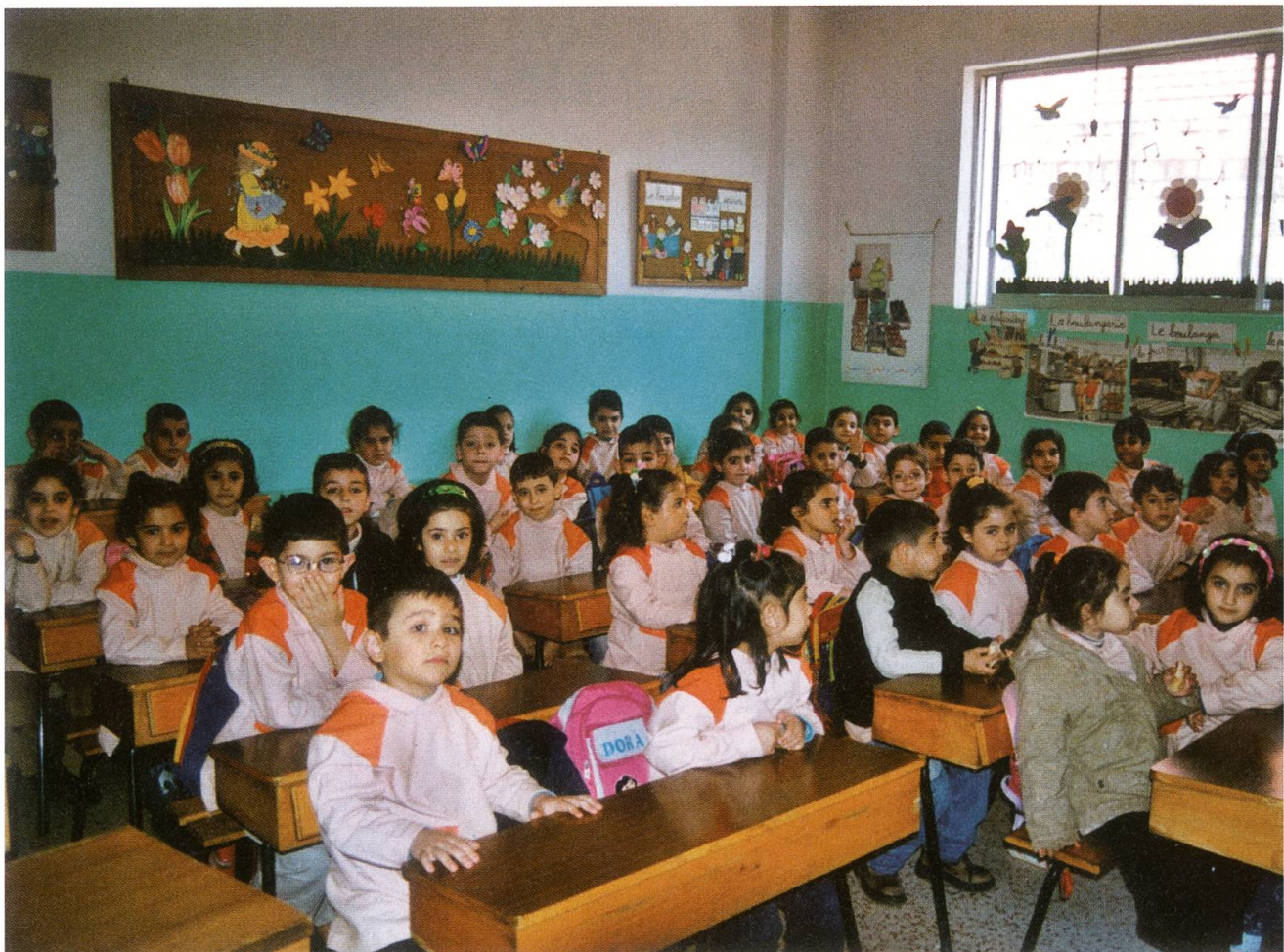
Kein Platz, kaum Ausrüstung: Schulzimmer der Pfarreischule in Bauchrieh.

Es liessen sich noch viele Punkte anfügen... Das Fazit lautet: Es ist unmöglich, alles auf einen Nenner zu bringen. Was es braucht, ist einerseits eine