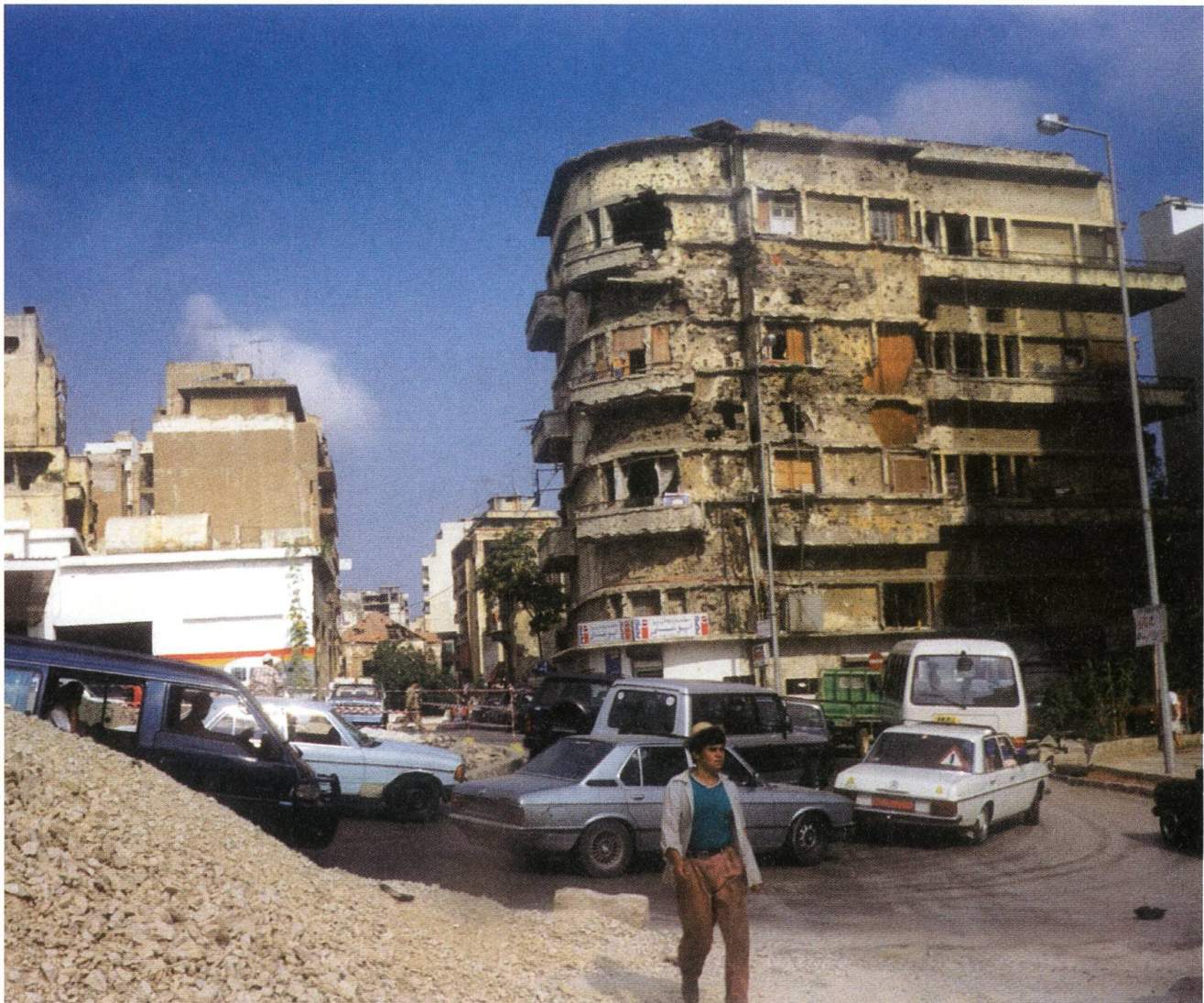
Die Verwüstungen durch die Kriege klaffen immer noch wie Wunden im Stadtbild: Beirut im Sommer 2006.

Humanitäre Hilfe ist kein Sonntagsgeschäft. Sie ist dort notwendig, wo Länder von chronischem Unheil heimgesucht werden, und in der überwiegenden Zahl der Fälle trifft man die gleichen Strukturen: Die Gesellschaft zerfällt in Clans, die sich um Führungsgestalten sammeln und miteinander in feindlicher Konkurrenz um knappe Ressourcen leben. Klientelismus (die Erfindung der alten Römer: «Klienten» sammeln sich um Politiker und sichern ihnen die Macht, während diese ihnen materielle Hilfe und Schutz garantieren) ist fast