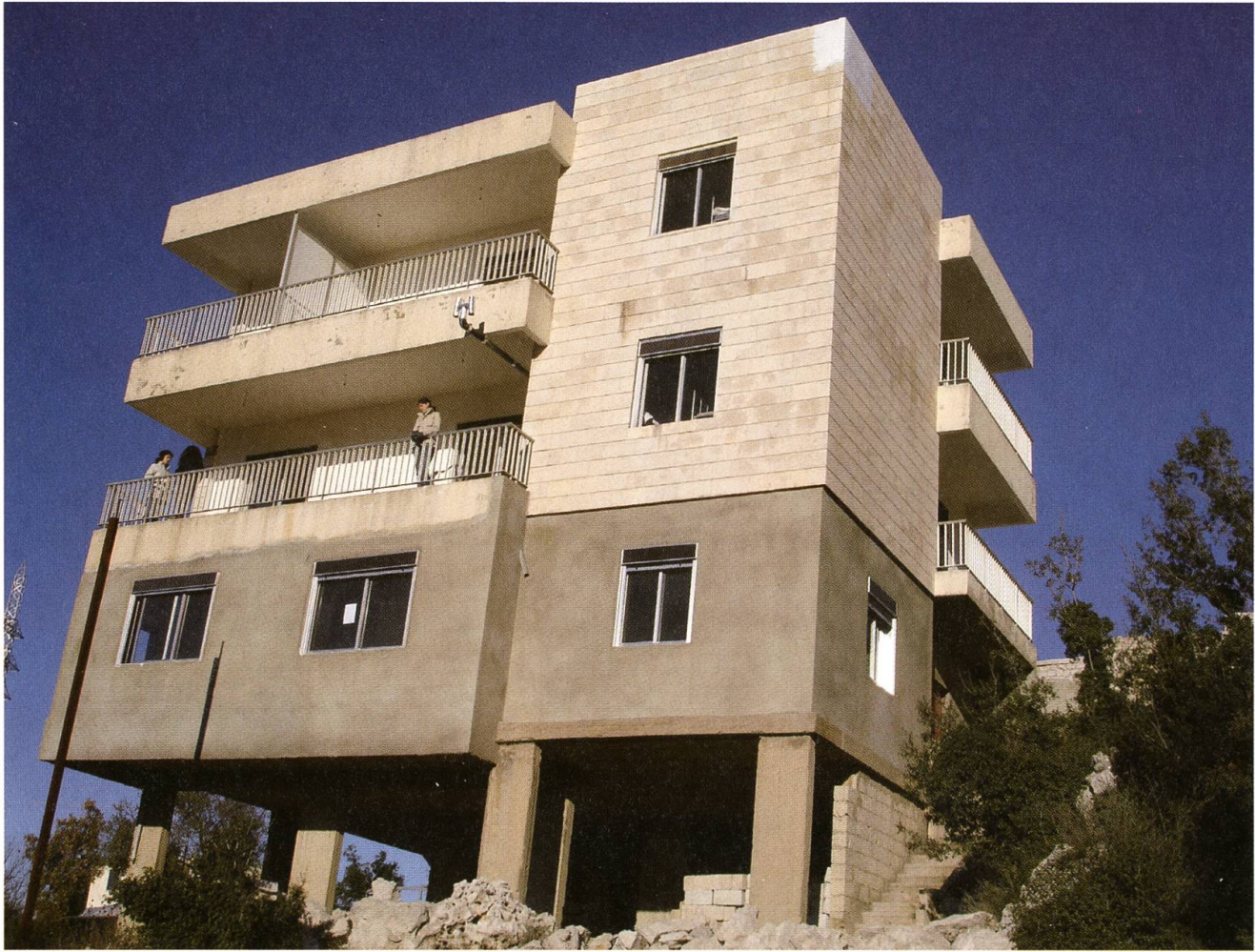
Das Haus des Friedens in Achkout, einigermaßen renoviert.

Dank der grosszügigen Spende der Firma Victorinox in Ibach SZ konnte nahe beim Städtchen Achkout, auf einem Hügelzug 35 Kilometer nördlich von Beirut mitten in einer eindrücklichen Naturlandschaft auf 1000 Metern Höhe ein Gebäude erworben und hergerichtet werden. Ursprünglich als Luxusresidenz einer reichen Familie entworfen, die es aber nie bezog, stand das Gebäude noch Anfang 2006 etwas heruntergekommen und ziemlich einsam in der Landschaft. Das umliegende Gelände ebenso wie der Boden, auf dem es sich befindet, gehört einer Beiruter Pfarrei und wurde seit Jahren für Ferienkolonien genutzt, mit Zelten und einer notdürftig eingerichteten Küche.