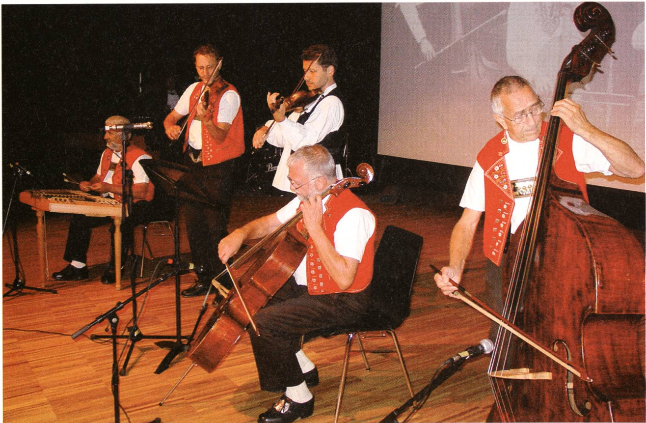
Überväter der Appenzeller Volksmusik: die Alder Buebe während ihres Auftritts am Gala-Abend.