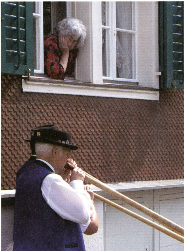
Ein Ständchen für sie genauso wie...