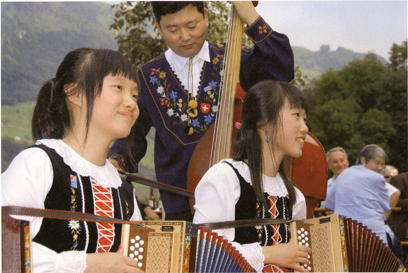
Kim's Korean Swiss Modi Kapelle. Noch Fragen?