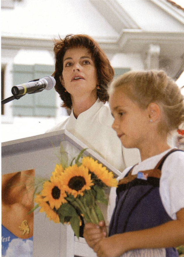
Hoher Gast am Sonntag: Bundesrätin Doris Leuthard.