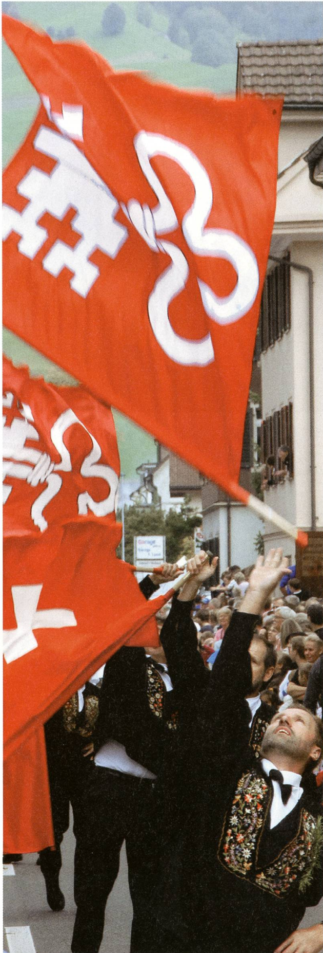
Fahenschwingen am Umzug...