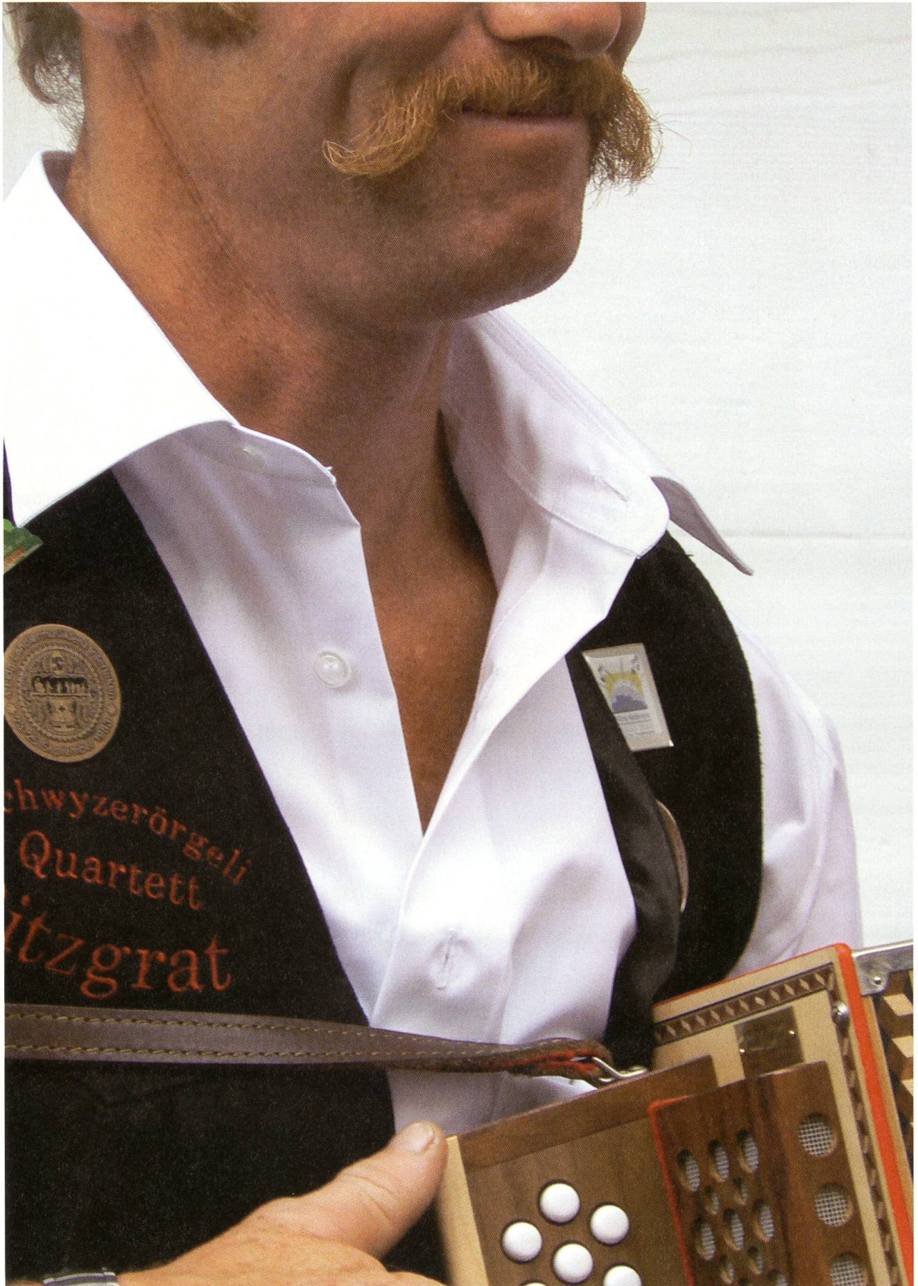
Ein lüpfiger Schottisch – und das Lächeln kommt von selbst.