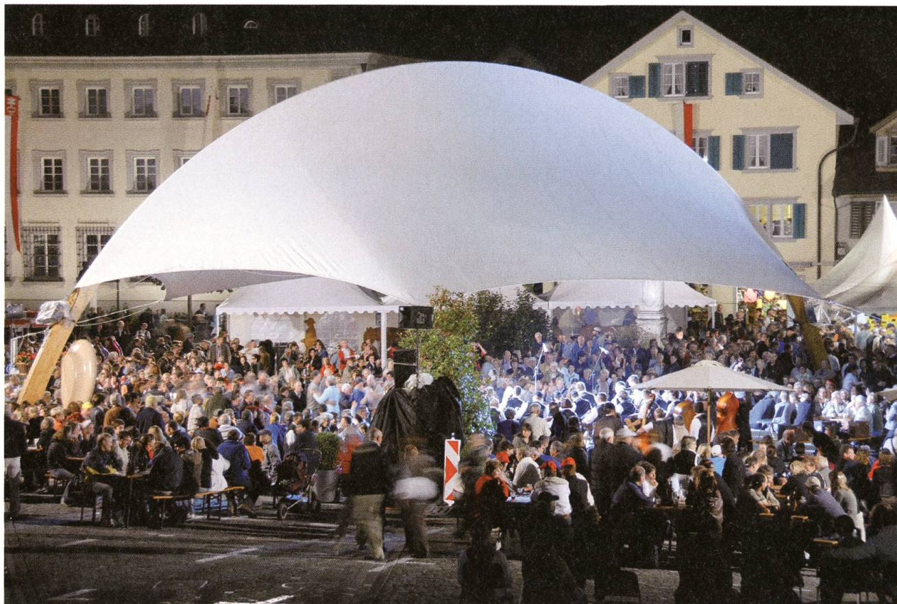
Das grosse «Festzelt» verlieh dem Dorfplatz eine besondere Ambiance.