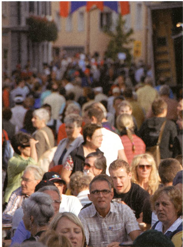
...für 60'000 Fans.