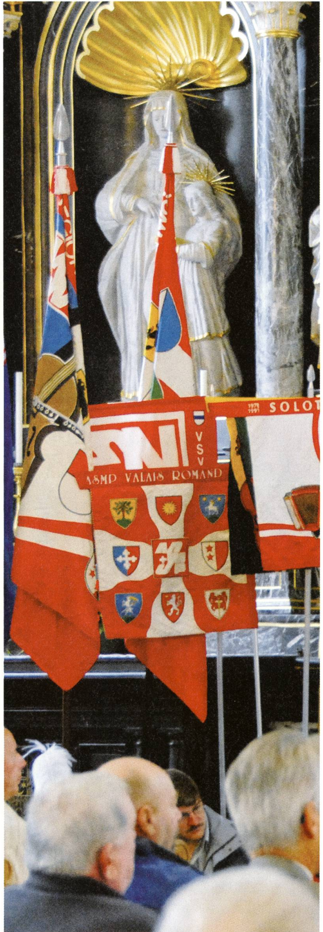
...und Andacht in der Kirche.