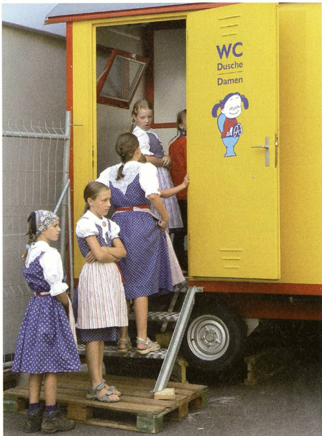
Damit nachher beim Auftritt niemand zapplig wird.