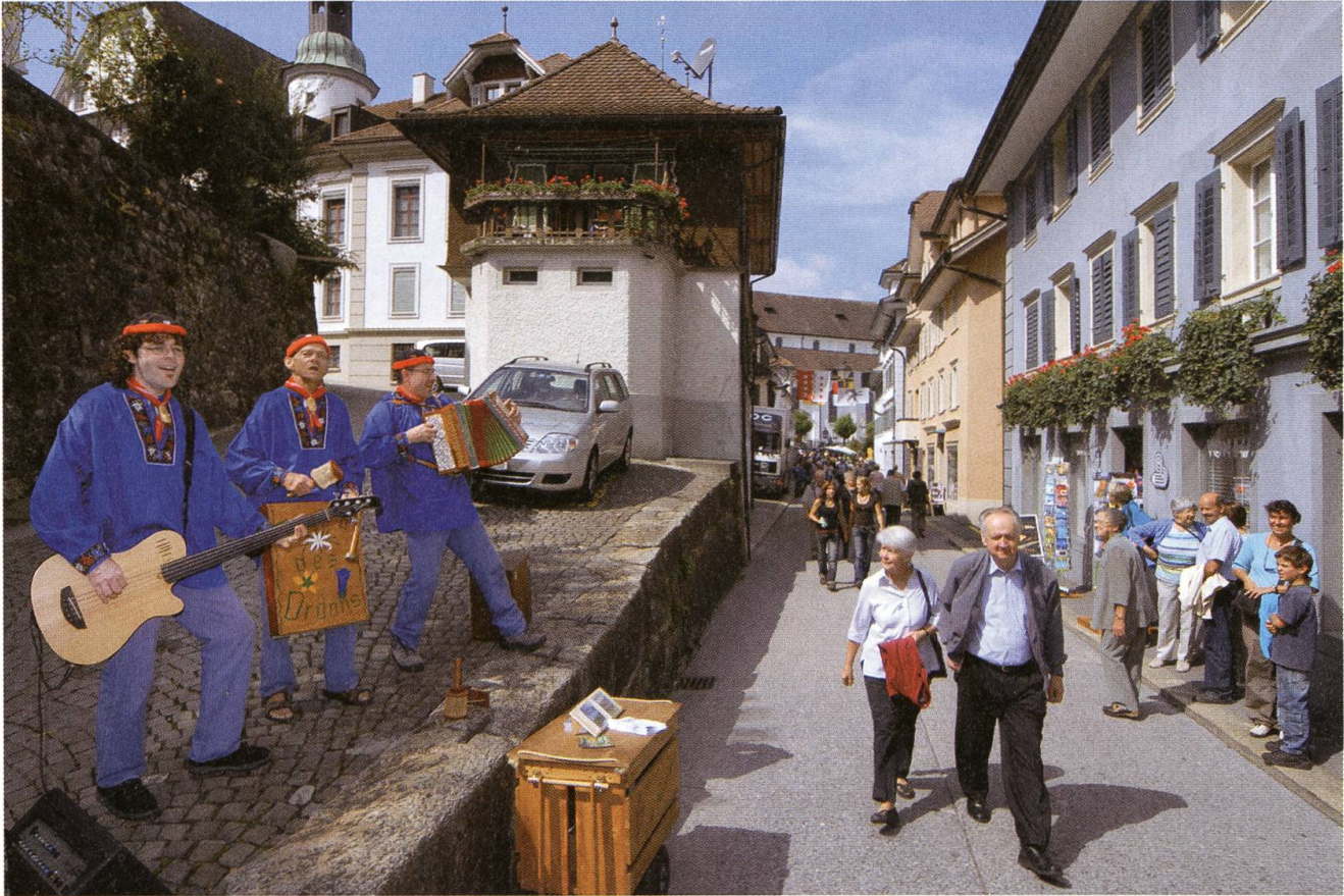
Alle Facetten der Volksmusik. Zum Beispiel als Strassenmusikanten.