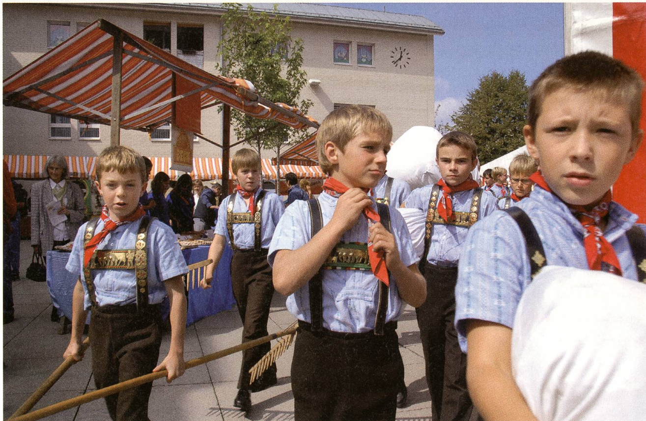
Nachwuchs-Buben machen sich gut ausgerüstet für den Umzug parat.