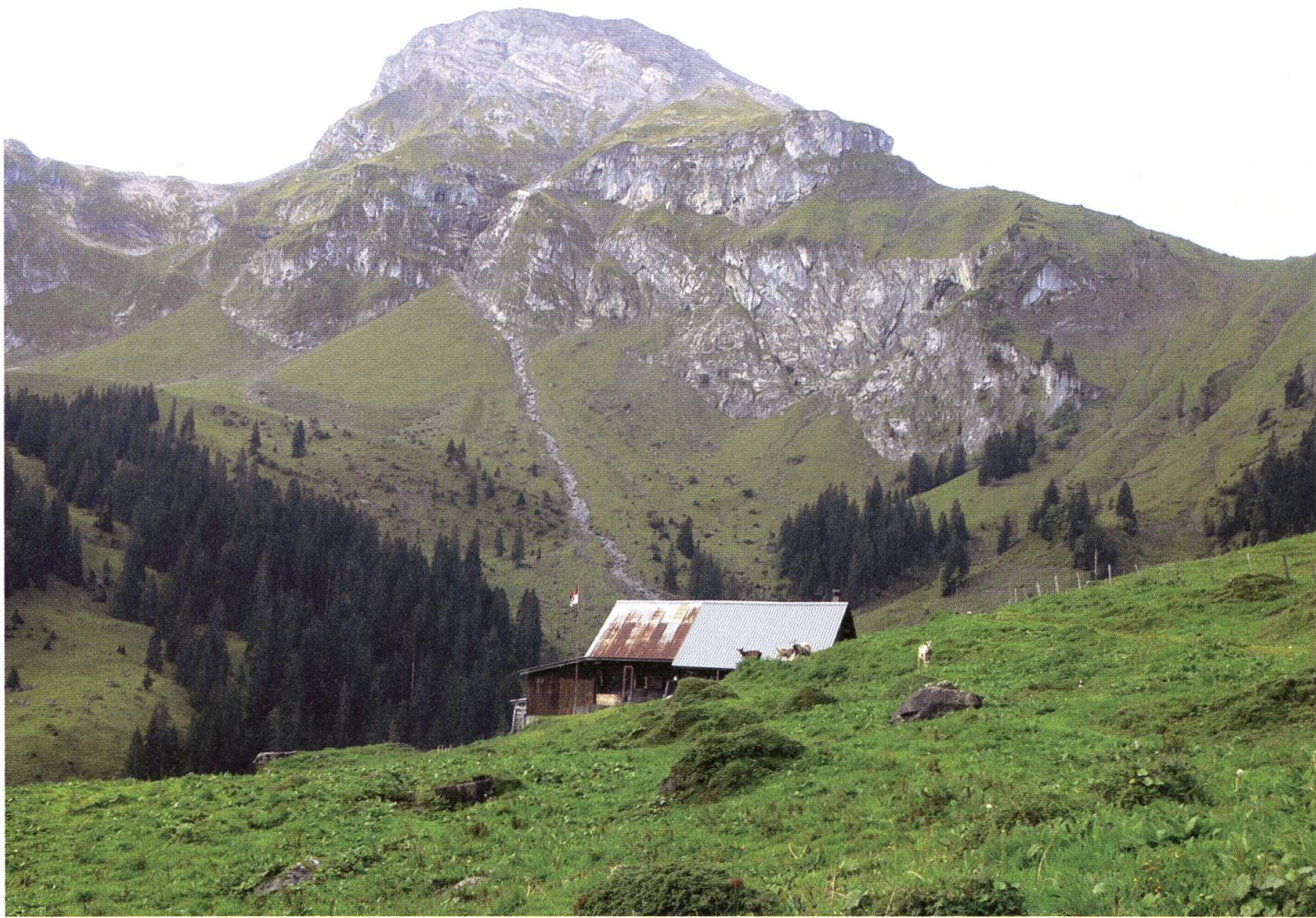
Hier weht die Obwaldner Fahne: Die Alp Lutersee.

verbesserungen zur Optimierung der Wirtschaftlichkeit der Alpen fordern und gleichzeitig tatenlos zur Kenntnis nehmen, dass infrastrukturelle Massnahmen durch Einzelinteressen verhindert werden.»