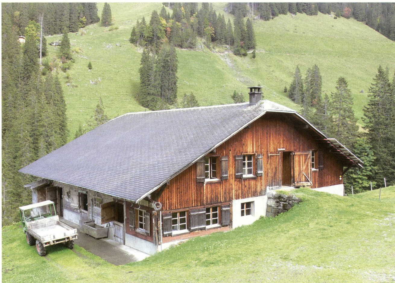
Die Alp Brändlisboden oberhalb von Beckenried.