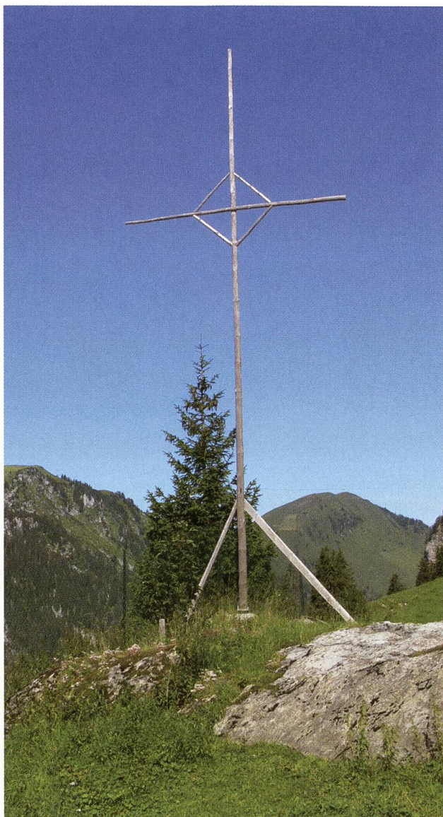
Mit Gottes Segen: Kreuz auf der Alp Stafel.

Der vollständige Bericht «Nidwaldner Alpwirtschaft – Potentialanalyse und Entwicklungsplan im Auftrag der Arbeitsgruppe Alpwirtschaft Nidwalden» ist im Internet zugänglich, Stichwort «Nidwaldner Alpwirtschaft» oder unter www.landwirtschaft.nw.ch