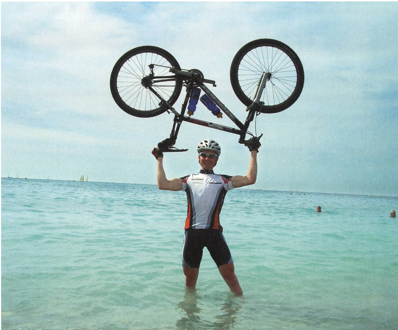
...im Ziel! – Traum erfüllt.