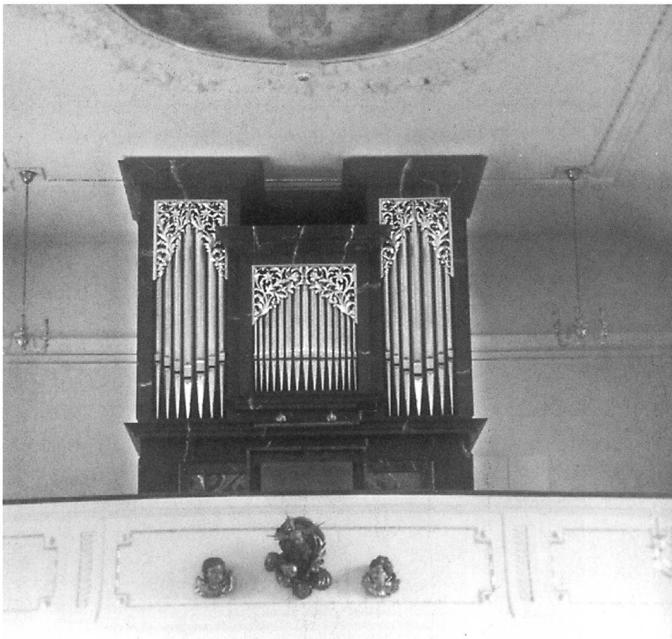
Orgel in der Wallfahrtskapelle Kehrsiten