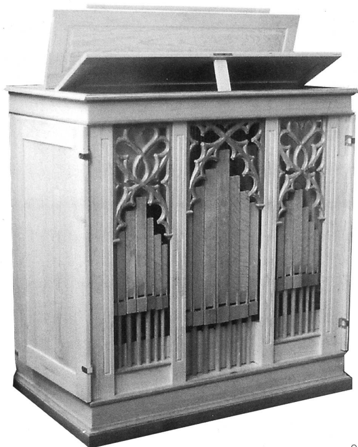
Orgel des Oberen Beinhauses Stans

an der Kanzelseite, über der Sakristei aufgestellt. Sie ist eine frühbarocke einmanualige, 8 Register zählende Chororgel mit beidseitigem Prospekt aus dem Jahre 1646, das einzige original nahezu komplett erhaltene Werk des berühmten Alpnacher Orgelmachers Niklaus Schönenbüel. Das edel singende Instrument des Obwaldners ist historisch, kann aber dennoch weiterhin auch in der gewandelten und im Wandel stehenden Liturgie sinnvoll eingesetzt werden. Die andere thront auf der oberen Empore an der Nordwand, die Hauptorgel, mit 3 Manualen und 43 Registern die grösste des Kantons. Ihre Anfänge lassen sich äusserlich am Gehäuse zumindest bis ins frühe 18. Jahrhundert nachweisen. Klanglich und technisch stammt das heutige prächtige Instrument