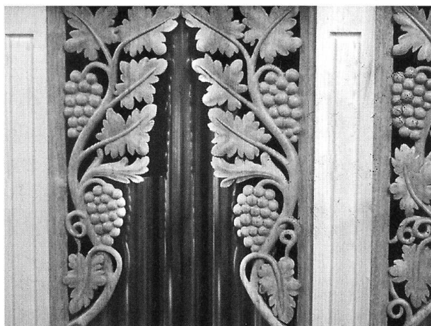
Detail Orgelprospekt mit Schnitzwerk