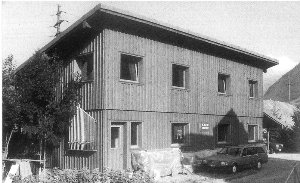
Orgelwerkstatt E. Erni im Rotzwinkel, Stans

der Name Schefold auf, so vor allem im Wallis. Die Überlieferung der gebauten Schefold-Orgeln ist hingegen sehr fragmentarisch. Sie erlaubt keine Erstellung eines Werkverzeichnisses.