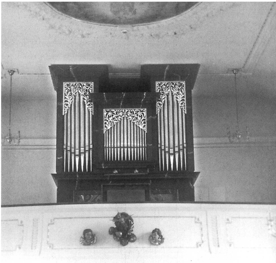
Orgel in der Wallfahrtskapelle Kehrsiten