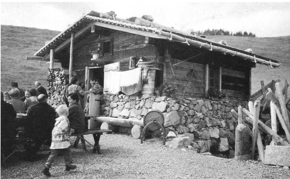
Beim Ausflug der Alpbannwarte galt der Besuch der 2001 errichteten Nostalgie Schaukäserei Chieneren, Alp Dürrenboden. Mit Liebe zum Detail wurde auch die historische Bauweise nachgehamt.

Heute diktiert weitgehend der freie Markt beim internationalen Warenaustausch, welche Produktionsrichtung im Primärsektor in der Schweiz und regional einzuschlagen ist. In diesem Zusammenhang sind die Begriffe AP 2002, Szenario AP