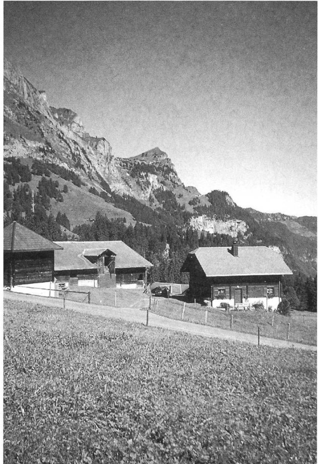
Alpbetrieb auf Untertrübsee mit Blick zum Arnizingel.

chengesetzgebung geregelt. Im Blick auf den Viehexport hat sich das nationale Veterinärrecht zunehmend am internationalen Recht zu orientieren.