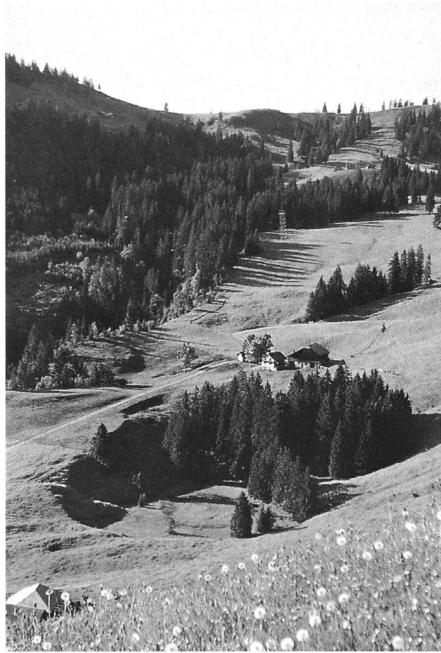
Das Alpegebiet beim Dürrenbodenseeli mit dem Alpbetrieb Meiershütte, im Hintergrund der Eggligrat.

Bei der Ausgestaltung der zukünftigen kantonalen Agrarpolitik sowie der Massnahmen ist es von Bedeutung, dass man sich der Multifunktionalität der Landwirtschaft bewusst ist: Nahrungsmittelproduktion, Erhaltung biologischer Vielfalt, Pflege des Lebens- und Erholungsraumes und der touristisch genutzten Berglandschaft, Gewährleistung der dezentralen Besiedelung.