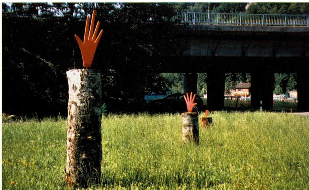
Von Lukas Gasser Holz mit roten Händen aus Kunststoff

Aber die Kulturkommission wäre nicht die Kulturkommission, wenn sie nicht auch an ihrem zehnjährigen Jubiläum ihrem Prinzip treu geblieben wäre, Kultur für alle zu bieten. Wer mit den ausgestellten Kunstwerken nichts anfangen konnte,