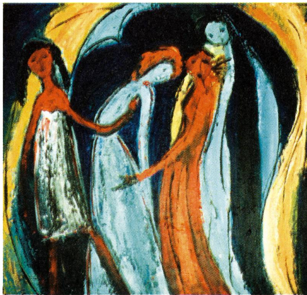
unten: Eleonore Amstutz