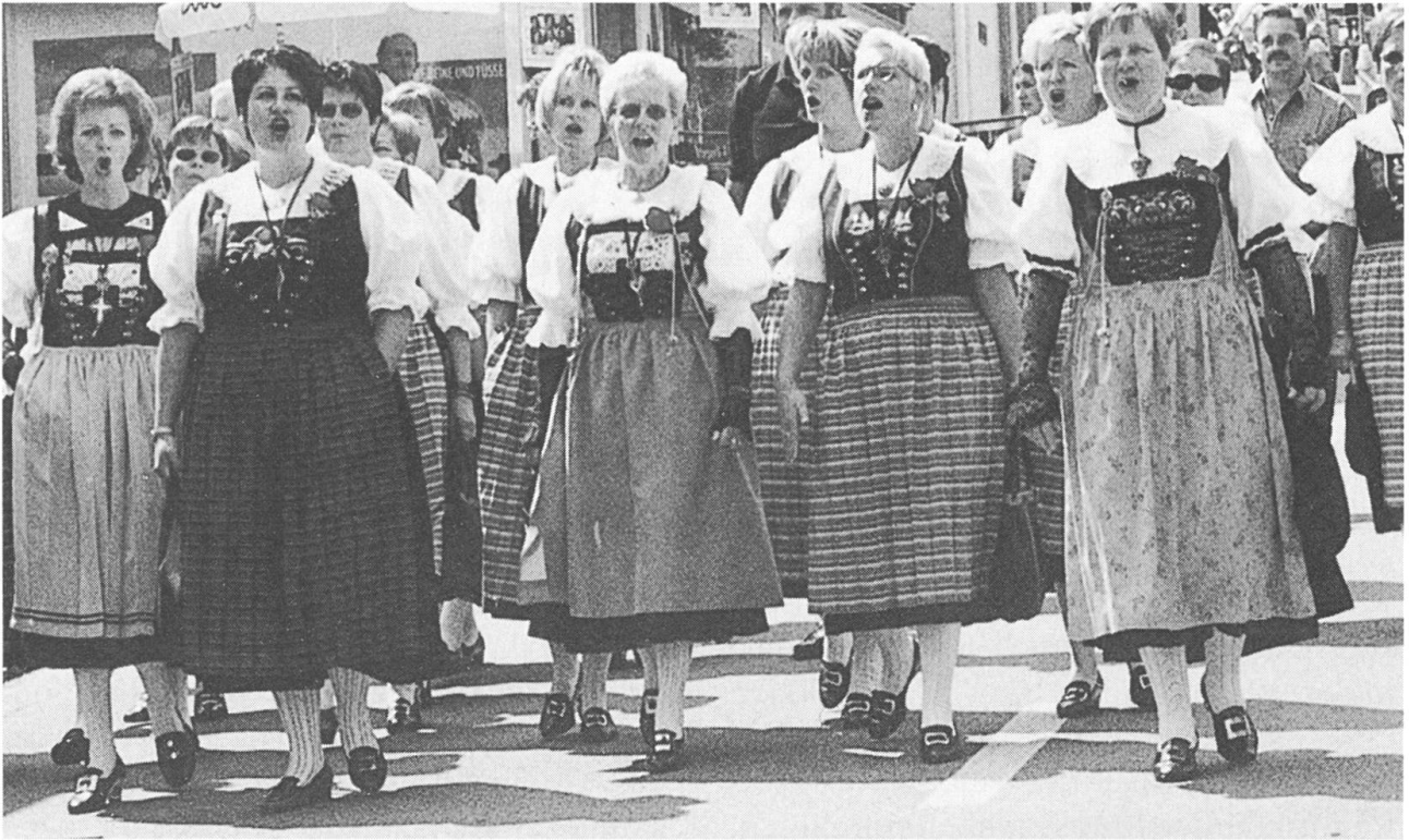
Nach dem Wettvortrag lässt es sich gut auf der Strasse jodeln.