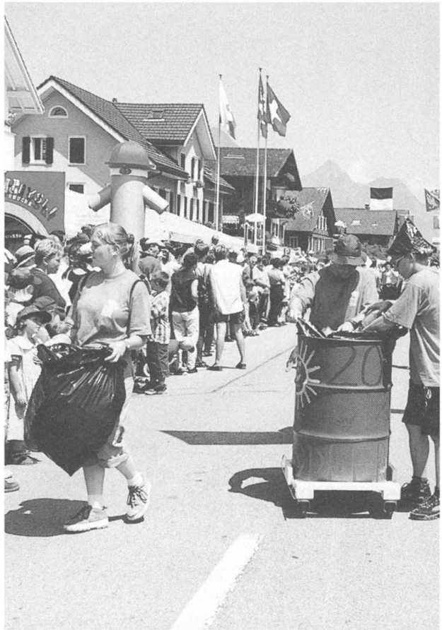
So lernten die gescheiterten Buochser die Jugend zum sauberen Dorf Sorge tragen.

Rund 25 000 Personen beklatschten die 49 Nummern des Festumzuges, der ebenfalls unter dem Festmotto «Alt und Jung under eim Huet» stand. Er veranschaulichte, dass es Brauchtum, traditionelle Volksmusik, Jodelgesang, Alphornblasen und Fahنشwingen in unserem Land noch gibt. Echte unverfälschte Volksmusik ist Weltmusik, und wer einmal an einem Jodlerfest war, den lässt der Jodlervirus nicht mehr los. Von diesem Virus angesteckt zeigten sich Schüler der Orientierungsstufe Buochs, die als sogenannte «Saubermänner» mehrmals im Umzugsprogramm auftauchten. Die Schüler hatten im Vorfeld mit ihren Lehrern ein Entsorgungskonzept erarbeitet. Gekleidet in grüne T-Shirts und ausgerüstet mit fahrbaren Abfall-Fässern sammelten sie während des Umzuges und des ganzen Festes die Abfälle ein und entsorgten diese umweltgerecht. Wahrlich eine Arbeit,