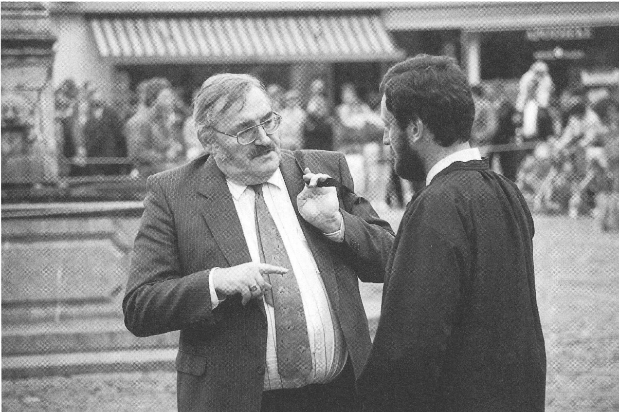
Bei fast allen Volksfesten war er dabei, aufmerksam wie im Rathaus. Hier im Gespräch an der Älperkilbi in Stans.

in ihrer Pointierung von den allmorgendlichen DRS-Analysen an Originalität, Witz, aber auch Zurechtweisung deutlich abhebt. Ins Gericht geht er dabei mit dem Magazin «Weltwoche», und das mit gutem Grund, weil es die Wolfenschiesser in ein makabres Licht stellt und Nidwalden lächerlich macht. Flurys Konterung ist dementsprechend knallhart realitätsbezogen, indem er vorwirft: der Weltwoche-Autor «beschreibt nicht die Zwietracht in Wolfenschiessen, sondern provoziert sie.»